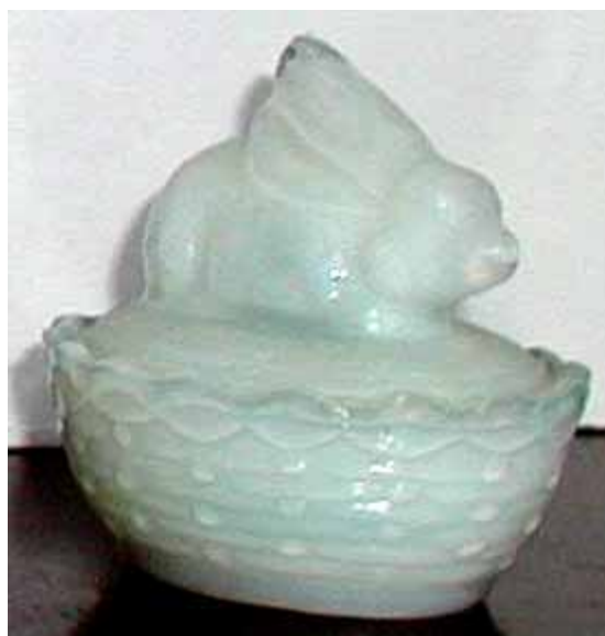
Abb. 2004-1/361 Deckeldose Hase liegend auf einem Korb opak-weißes Pressglas, H 6 cm, L 6 cm, B 5,5 cm Sammlung Fehr Hersteller unbekannt, gemarkt „V in Kreis“