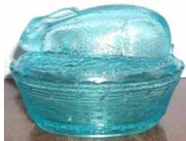
Abb. 2004-1/360 Deckeldose Hase liegend auf einem Korb farbloses Pressglas, H 14 cm, L 20 cm, B 16 cm Sammlung Fehr s. Haupt-Katalog Brockwitz 1928, Tafel 87, Zuckerdosen, Nr. 8446, Abb. 02-2000/299