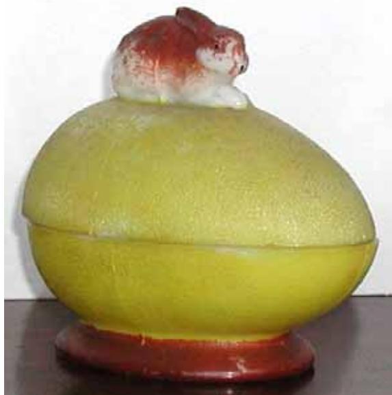
Abb. 2004-1/366 Deckeldose Hase liegend auf einem Ei opak-weißes Pressglas mit bunter Kaltbemalung H 13 cm, L 13,5 cm, B 9 cm Sammlung Fehr wohl Vallérysthal, s. Abb. 2004-1/365 vgl. Abb. 1999-2/012 vgl. Maus auf einem Ei s. MB Portieux 1914, Septième Partie, Planche 3, Folios 3, Sucriers, Nr. 6670 [Abb. 2004-1-11/023]