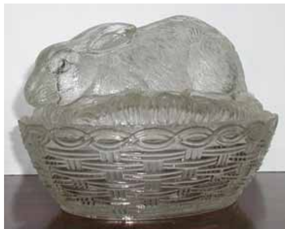
Abb. 2004-1/360 Deckeldose Hase liegend auf einem Korb farbloses Pressglas, H 14 cm, L 20 cm, B 16 cm Sammlung Fehr s. Haupt-Katalog Brockwitz 1928, Tafel 87, Zuckerdosen, Nr. 8446, Abb. 02-2000/299