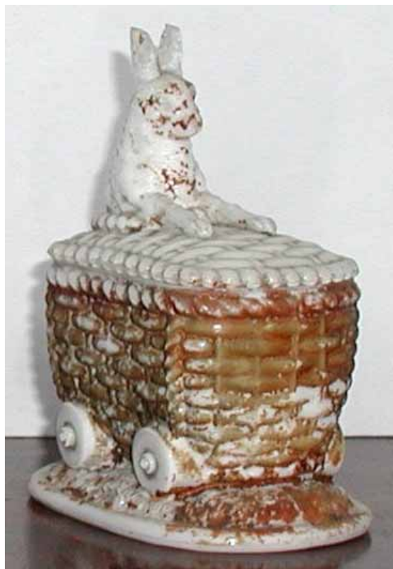
Abb. 2004-1/358 Deckeldose als Hase in einem Korb auf Rädern opak-weißes Pressglas, bemalt, H 10 cm, L 8,5 cm Sammlung Fehr s. MB Streit 1913, Tafel 15, Nr. 984, Hasendose, oval