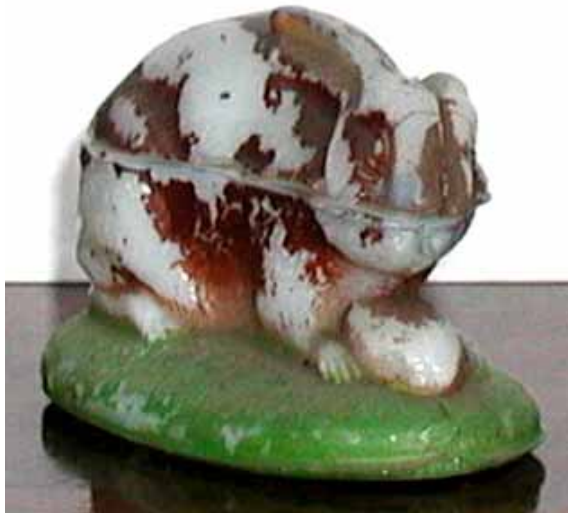
Abb. 2004-1/370 Deckeldosen Hase farbloses Pressglas, H 5 cm, L 7 cm, B 4 cm farbloses Pressglas, H 8,5 cm, L 11,5 cm, B 7 cm Sammlung Fehr Hersteller unbekannt, vgl. Abb. 2004-1/363, Vallérysthal