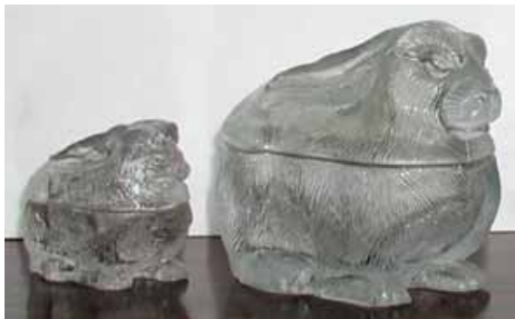
Abb. 2004-1/370 Deckeldosen Hase farbloses Pressglas, H 5 cm, L 7 cm, B 4 cm farbloses Pressglas, H 8,5 cm, L 11,5 cm, B 7 cm Sammlung Fehr Hersteller unbekannt, vgl. Abb. 2004-1/363, Vallérysthal