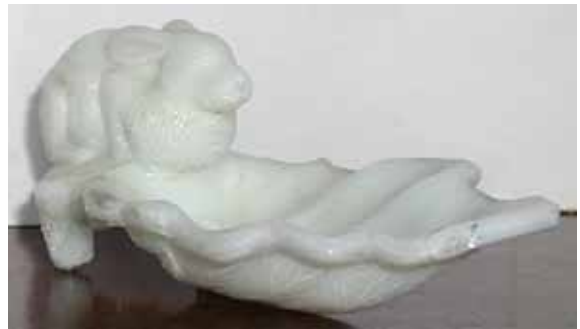
Abb. 2004-1/372 Deckeldose mit liegendem Hasen auf einem Korb (kleines Salzfaß, s.a. Abb. 2004-1/379) opak-weißes Pressglas, an den Rändern durchscheinend, Reste von Goldbemalung, H 8,0 cm, L 8,8 cm, B 6,4 cm Sammlung Peltonen Hersteller unbekannt gekauft in Edinburgh, Schottland 2003