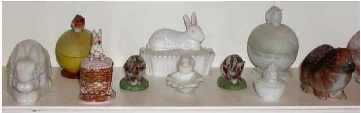
Abb. 2004-1/355 Deckeldosen mit Hasen, Sammlung Fehr, siehe Abbildungen unten