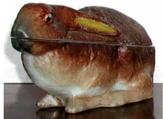
Abb. 2004-1/364 Deckeldose Hase opak-weißes Pressglas mit bunter Kaltbemalung, H 8,5 cm Sammlung Neumann, gemarkt „VALLERYSTHAL“ s. Musterbuch Vallérysthal 1908, Folio 303 & 304, Nr. 3772

Abb. 2004-1/363 Deckeldose Hase opak-weißes Pressglas mit bunter Kaltbemalung, H 7,6 cm Sammlung Fehr, innen gemarkt „VALLERYSTHAL“ s. Musterbuch Vallérysthal 1908, Folio 303 & 304, Nr. 3772