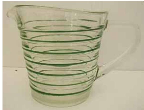
Abb. 2004-2/201 Flødekande [Sahnekännchen] farbloses Pressglas m. grünen Streifen, H 8,5 cm, D 7,5 cm farbloses Pressglas m. roten Streifen, H 8,5 cm, D 7,5 cm goldgelbes [gyldengult] Pressglas, H 8,5 cm, D 7,5 cm Sammlung Andersen MB Holmegaards Glasværk 1950, Blatt 101 Pressemønstret „Broksø“ Farben „hvidt, gyldengult, ravgult, græsgrønt, koboltblå“ [hell/weiß, goldgelb, bernsteingelb, grasgrün, kobaltblau]

PK 2004-2 Bloch, SG, Pressgläser aus Bloch, Danks presset glas 1850-1950. Parallelen zu Pressglas anderer Glaswerke