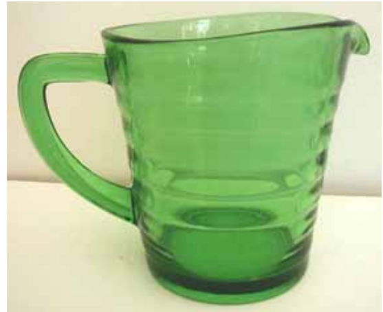
Abb. 2004-2/205 Sennepsglas [Senftopf] grünes [grøn] Pressglas, H 6,5 + 4,0 cm, D 6,1 cm Sammling Andersen MB Holmegaards Glasværk 1950, Blatt 101, Pres- semønstret „Broksø“