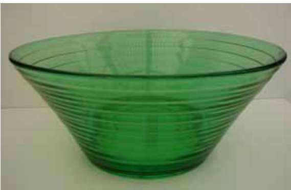
Abb. 2004-2/208 Schale [skål] grünes [grøn] Pressglas, H 8,5 cm, D 28,5 cm Sammlung Andersen MB Holmegaards Glasværk 1950, Blatt 101 Pressemønstret „Broksø“