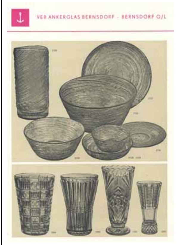
Abb. 2003-1-1/007 Prospekt Verkaufsgemeinschaft Pressglas 1968 VEB Ankerglas, Vasen, verwärmt (fire polished) Sammlung Schmaus