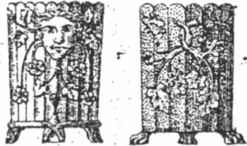
Abb. 2004-2/040 (Ausschnitt) MB Verreries Réunies Sars-Poteries (Nord), Imbert & Cie., 1885, Planche 94 Nr. 2147, „Jardinière Ronde chimères petite et grande, blanc, opal ou Iris“ Nr. 2146, Jardinière Ronde Pierre petite et grande

Christoph: Ich glaube nicht, dass die beiden Jardinières aus Sars-Poteries stammen. Die Füße entsprechen nicht der Zeichnung des Musterbuchs von 1885. Die beiden Jardinières haben auch Ähnlichkeit mit der "jardinière rustique" im Catalogue des Verreries de Bayel et Fains 1923, Planche 78, N° 3617. Das betrifft die allgemeine Form und die Füße (wilde Beeren, z.B. Maulbeeren). Wir haben dieses Glas in „opaline bleu“ und „opaline blanche“ in 2 Größen, H 11 cm und H 7,4 cm. [Übersetzung SG]