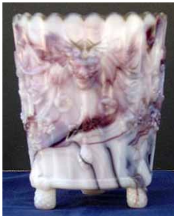
Abb. 2004-3/071 b Vase mit Maske / Chimäre, Efeu, Ranken, Blumen, Beeren opak-weißes, marmoriertes Glas, H 8,4 cm, D xxx cm Sammlung N.N. ohne Marke vgl. Abb. 2004-2/040, MB Verreries Réunies Sars-Poteries 1885, Planche 94, Nr. 2147, Jardinière Ronde chimères vgl. MB Bayel 1923, Pl. 78, Nr. 3617, Jardinière rustique

Marc Christoph hat außerdem das Foto einer opak-weißen, marmorierten Variante der kleinen Vase mit Maske aus der Sammlung eines Freundes geschickt. Das marmorierte Glas macht die Suche nach dem Hersteller nicht gerade leichter. Allerdings sind schon einige marmorierte Gläser in den gleichen Farben aufgetaucht, deren Hersteller in Frankreich - nicht in England - vermutet wird. (z.B. Abb. 2004-1/070, Abb. 2004-1/151, Abb. 2004-3/471, Abb. 2004-3/472)