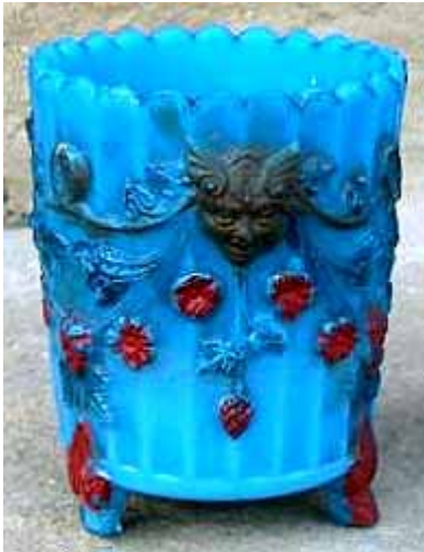
Abb. 2004-3/066 eBay Frankreich, Art.Nr. 2258992047, €96,50 "OPALINE VASE ET VERRE JOLI OPALINE BLEU. VASE H 9.5 cm, VERRE H 8 cm"