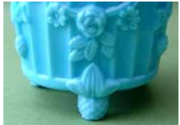
Abb. 2004-3/068 Vase mit Maske / Chimäre, Efeu, Ranken, Blumen, Beeren opak-blaues Glas, H 9,7 cm, D xxx cm Sammlung Christoph ohne Marke vgl. Abb. 2004-2/040, MB Verreries Réunies Sars-Poteries 1885, Planche 94, Nr. 2147, Jardinière Ronde chimères vgl. MB Bayel 1923, Pl. 78, Nr. 3617, Jardinière rustique