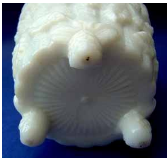
Abb. 2004-3/073 a/b

Vase mit Ranken und Beeren opak-weißes Glas, H 11 cm (und H 7,4 cm) Sammlung Christoph und Sammlung Fehr ohne Marke vgl. Abb. 2004-2/040, MB Verreries Réunies Sars-Poteries 1885, Planche 94, Nr. 2146, Jardinière Ronde Pierre petite et grande, blanc, opal ou Iris vgl. MB Bayel 1923, Planche 78, Nr. 3617