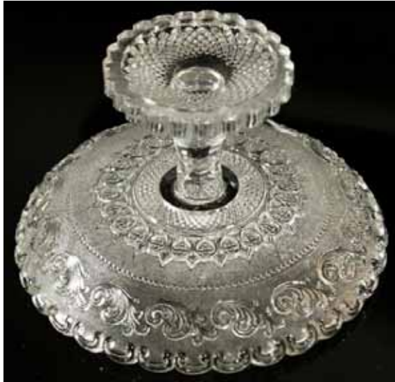
Abb. 2004-3/100 Schale mit Ranken-Dekor und Balluster-Fuß farbloses Pressglas, H 10,8 cm, D 17,7 cm, G 700 g Glasgalerie Jan Kilian s. MB Launay, Hautin & Cie. 1840, Pl. 45, Nr. 1699 u. 1703