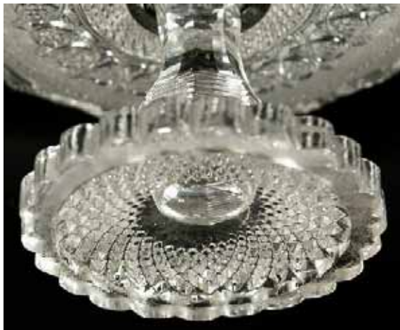
Abb. 2004-3/101 MB Launay, Hautin & Cie. 1840, 2. me Partie, Planche 45, Fußschalen Nr. 1699, Coupe F. évasée moulure sablée, Jambe balustre et guirlande, St. Louis, 8, 7 ½, 7, 6 ½, 6 frz. Zoll Nr. 1703, Coupe f. ordinaire moulure sablée, Jambe ba- lustre et guirlande, St. Louis, 7 ½, 7, 6 ½, 6, 5 ½ frz. Zoll