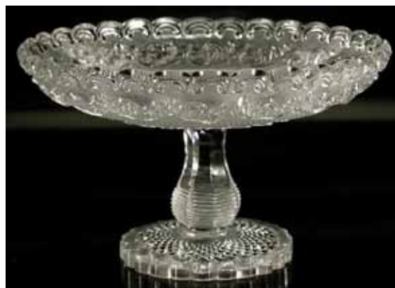
Abb. 2004-3/099 Schale mit Ranken-Dekor und Balluster-Fuß farbloses Pressglas, H 10,8 cm, D 17,7 cm, G 700 g Glasgalerie Jan Kilian s. MB Launay, Hautin & Cie. 1840, Pl. 45, Nr. 1699 u. 1703

Die Fußschale ( www.glaskilian.de/press/p087.html ) ist gleichfalls ein bemerkenswertes Stück: Schwere Tazza. Farbloses, sehr weißes Pressglas mit kristallartigem Klang. Schalenunterseite dicht strukturiert gepresst. Angeschmolzener Schaft mit horizontalen Presslinien, darüber Schälenschliff. Angeschmolzene Fußscheibe mit ausgekugeltm Abriss, plangeschliffenem Standring und ebenfalls von Hand nachgeschliffener Oberfläche (!). Ohne Marke. Wohl Frankreich, Mitte 19. Jhdt. H 10,8 cm, D 17,7 cm, G 700 g.