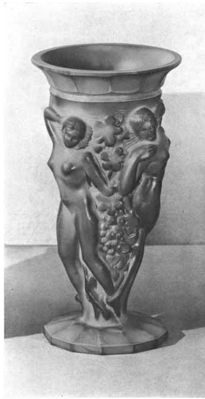
Vase in lapis und jade 23 cm 1006