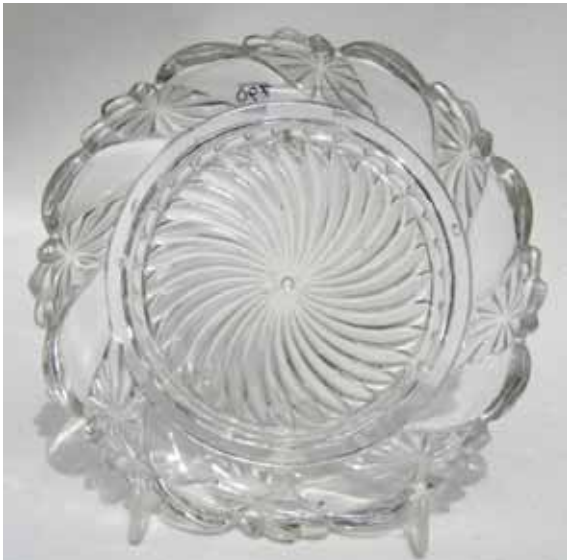
Abb. 2004-3/003 Untersetzer mit spiraligen Flächen, abwechselnd mit Rosetten, Boden m. großer, spiraliger Rosette farbloses Glas, H 2 cm, D 14 cm Sammlung Geiselberger PG-790 im Zentrum Marke „SV“ Hersteller unbekannt, Frankreich, um 1900? vgl. Musterbuch Portieux 1914, Pl. 373, Service Pacha Der Teller wurde von der Oberseite fotografiert, im MB werden die Schalen von der Unterseite dargestellt, deshalb ist die Drehrichtung des Dekors umgekehrt!

Le motif de l'assiette se retrouve dans le catalogue des verreries de Bayel et Fains, album A 1923: pl. 6, chopes à anse moulées, BY304; pl. 36, moutardiers, BY1608; pl. 37, beurriers, BY1650; pl. 39, sucriers, BY1822; pl. 42, coupes moulées, BY2001; pl. 45, coupes moulées, BY2064; pl. 52, articles divers, BY246; pl. 70, articles d'éclairage, BY3282. Le motif «Pacha» se retrouve pl. 339, 341, 344, 345, 347 du catalogue de Portieux 1914. Nous possédons une coupe «SV» bleue clair opaque avec ce même motif, D 23 cm, H 10 cm.“