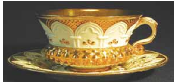
Abb. 2002-3/032 u. Abb. 2002-3/037 Tasse mit Untertasse mit gotischen Bögen u. Sternen, Porzellan m. Glanzvergoldung Tasse H 5,5 cm, D 10 cm Untertasse H 1,7 cm, D 15,1 cm Sammlung Stopfer Hersteller Manufaktur Meißen, um 1840 Tasse u. Untertasse vgl. MB Launay, Hautin & Cie. 1840, Pl. 45, Nr. 1709

Der Teller Abb. 2004-3/103 aus Porzellan war bisher nur aus der Sammlung Franke bekannt (Abb. 2000-2/068, Untertasse aus Porzellan, aus Franke 1990, Abb. 194, D 14,9 cm, Schwertermarke (= Porzellanmanufaktur Meißen)) und ist ebenfalls eine Kopie nach St. Louis, siehe Abb. 2001-05/323, Musterbuch Launay & Hautin um 1840, Planche 54, Tasse mit Untertasse Nr. 1873, mit neugotischem Muster, St. Louis, um 1840. Der Spiegel des Tellers aus Porzellan ist glatt, wahrscheinlich war die Oberseite des Tellers aus Pressglas auf der Oberseite völlig glatt. Die Zeichnung Nr. 1873 zeigt das Muster auf der Unterseite!