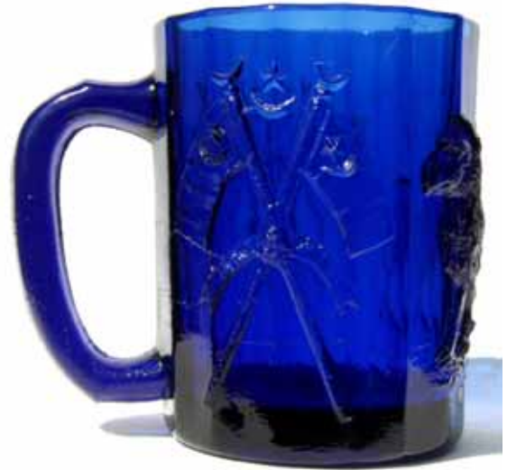
Abb. 2004-3/046 MB Bayel & Fains 1923, Tafel 43, Gobelets moulés pressés Planche 13, BY 631, Gobelets moulé Lion, à anse Henkelbecher mit Löwe, Halbmond und Stern, zwei gekreuzte Fahnen

Abb. 2004-3/048 Henkelbecher mit Löwe, Halbmond und Stern, zwei gekreuzte schmale Fahnen kobalt-blaues Pressglas, H 13 cm, D 10,2 cm (die Farbe ist viel dunkler als auf dem Foto!) viele Spannungsrisse auf der Oberfläche Sammlung Fehr, ehem. Lenek ohne Marke, Bayel, um 1880-1923 s. MB Bayel & Fains 1923, Tafel 43, Planche 13, BY 631