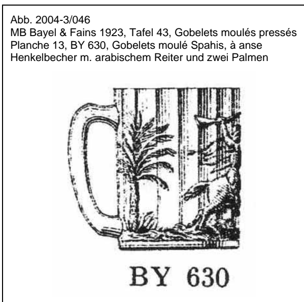
Abb. 2004-3/046 MB Bayel & Fains 1923, Tafel 43, Gobelets moulés pressés Planche 13, BY 630, Gobelets moulé Spahis, à anse Henkelbecher m. arabischem Reiter und zwei Palmen

Daudet schuf mit dem komisch-satirischen Roman "Les aventures prodigieuses de Tartarin de Tarascon" [Die wunderbaren Abenteuer ...] eine Persiflage des Francieurwesens, und mit Tartarin de Tarascon den Romanhelden, der die kleinstädtischer Philister der Stadt Tarascon und in der Provence in ganz Frankreich zum Urbild südfranzösischer Kleinbürger machte.