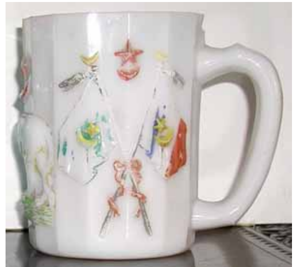
Abb. 2004-2/063 Henkelbecher mit Löwe, Halbmond und Stern, zwei gekreuzte breite Fahnen opak-weißes, kalt bemaltes Pressglas, H 13 cm, D 10 cm Sammlung Fehr, innen unten Marke „SV“ Hersteller unbekannt, Frankreich, um 1900 vgl. MB Bayel & Fains 1923, Tafel 43, Planche 13, BY 631