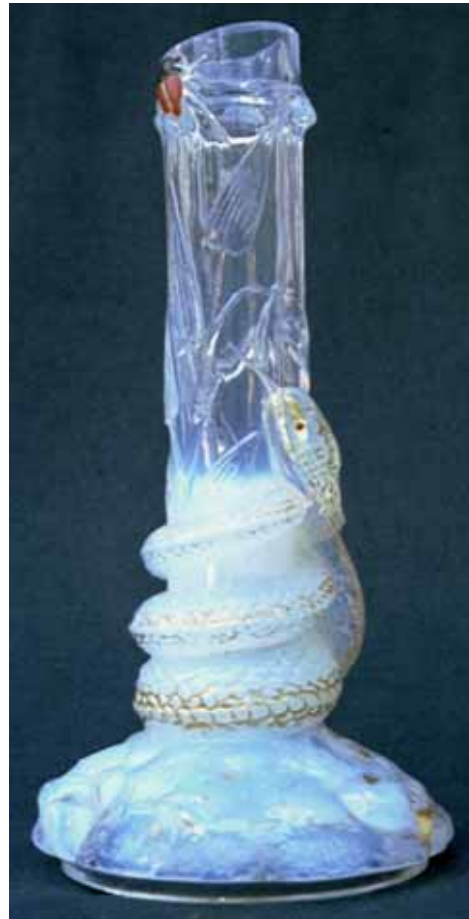
Abb. 2004-4/079 Vase mit Schlange an einem Bambusrohr Ausschnitt aus MB Baccarat 1870, Planche 306, Vasen Nr. 5.377, H 21 cm