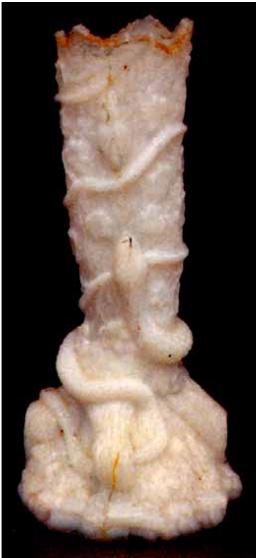
Abb. 2004-4/078 Vase mit angreifender Schlange an einem Baumstamm mit arglosem Vogel opak-weißes Glas, H 17,2 cm, D 7,9 cm Sammlung Chiarenza, im Boden Marke „SV“ Hersteller unbekannt, Frankreich, um 1900 aus Chiarenza 1998, S. 160, Abb. 382 s.a. Sammlung Christoph, farbloses Glas, H 17,8 cm

Chiarenza: „Ein ziemlich finsternes, kniffliges Stück, geformt als Baumstamm, der von einer sich windenden und ringelnden Rebe umschlungen wird und dessen starke Wurzeln hart am Stamm abgeschnitten wurden. Zwischen den Wurzeln und der Rebe klettert eine dünne Schlange den rauen Stamm hinauf, ihre Augen fixiert auf einen arglosen Vogel, der auf einem Zweig der Rebe sitzt. Ein Stück von erstaunlicher Spannung. Ein weiteres rätselhaftes Milk Glass mit eingepresster Marke „SV“, hier innerhalb des tief ausgehöhlten Sockels der Vase. Bisher nur bekannt als opak-weißes Glas.“