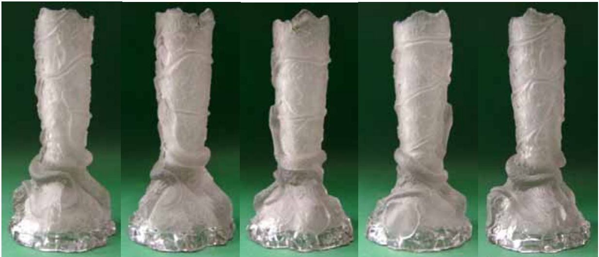
Abb. 2004-4/077 Vase mit angreifender Schlange an einem Baumstamm mit arglosem Vogel, farbloses, mattiertes Glas, H 17,2 cm, D xxx cm Sammlung Christoph, im Boden Marke „SV“, Hersteller unbekannt, Frankreich, um 1900, s.a. Chiarenza 1998, S. 160, Abb. 382