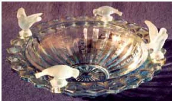
Abb. 2004-4/282 (ehem. Abb. 2003-3/199) Schale mit Pseudo-Schliffdekor, mit 4 aufgesteckten Vögeln hellblaues Glas, H 6,5 cm (ohne Vögel), D 26 cm Sammlung Stopfer s. MB Brockwitz 1941, Tafel 34, „Service 85000 Fortuna“, Nr. 83027, 26 cm s.a. PK Abb. 2003-4/346, PK Abb. 2004-3/282 u. /283

Vor einem Jahr wurde der Hersteller der Schale mit den aufgesteckten Vögeln noch in der Tschechoslowakei in den 1930-er Jahren vermutet. Inzwischen wurde der Hersteller gefunden: Glasfabrik Brockwitz AG, Brockwitz, bei Meißen, „Service 85000 Fortuna“, angeboten im Musterbuch Brockwitz 1941, Tafel 34-36. Es handelt sich um 3 hellblaue Schalen: eine hat 4 eingepresste Löcher im Rand, in die vier Vögel (Tauben?) aufgesteckt werden können. Zwei kleinere Schalen haben 3 FüÙe. Die kleinste Schale kann in die mittlere Schale so hinein gestellt werden, dass die Ränder oben gleich hoch sind.