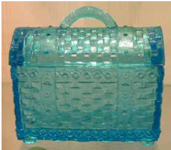
Abb. 2004-3/168 Reisekorb mit Metallbeschlägen und seitlichen Griffen blaues Pressglas, L 11,7 cm, B 7,9 cm, H 6,3 + 4,3 cm Sammlung Lenek Marke „B.S. Y DEPONIRT“ (inzwischen nachgeprüft) Meisenthal, um 1900