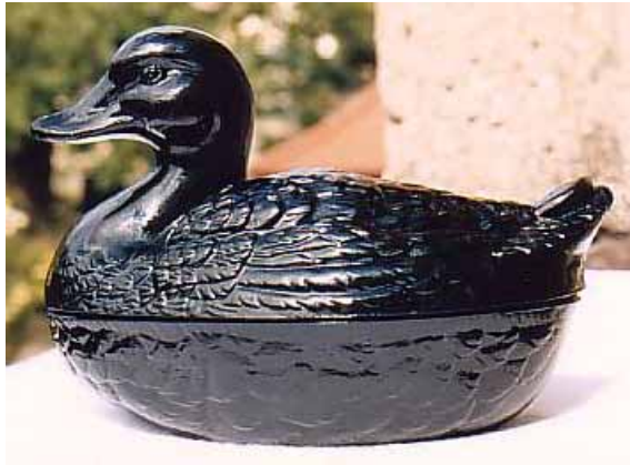
Abb. 2004-4/195 Deckeldose als Ente opak-schwarzes / dunkel-violettes Glas, H 11,5 cm, L 17 cm Sammlung Zeh SG: Hersteller unbekannt, Polen / Schlesien?, um 1900?

Neuerwerb ist auch eine Ente, die ich bisher in dieser Art noch nicht gesehen habe. Laut polnischem Verkäufer ist sie aus Schlesien und alt ... Alt glaube (hoffe!) ich schon, denn sie hat Standspuren und auch im Unterteil am Rand einen kleineren Ausbruch. Sie ist dunkelviolett, wenn man sie gegen das Licht hält. Ist Ihnen die Art bekannt? [SG: Eine Entendose dieser Art ist mir bisher nicht begegnet, weder real, noch in einem Musterbuch - vom Aussehen würde ich sie auch als alt einschätzen, die Unterseite der Dose sieht aus wie bei einer irdenen Dose, wenn ich nicht wüsste, dass die Dose aus Glas ist. Die tief-violett durchscheinende Farbe deutet auf die Zeit hin, in der viele Glashütten noch Schwierigkeiten hatten, ein echtes opak-schwarzes Glas zu machen.]