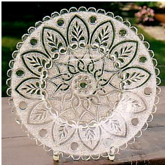
Abb. 2004-4/193 Teller mit Schlingen und Blättern, regelm. feine Körnung farbloser Glas, D 22,5 cm Sammlung Zeh englische Registriermarke für 20. Juni 1873 Sowerby & Co., Gateshead-on-Tyne, Reg.No. 273866, Parcel No. 13 [nach Slack 1987, S. 161]

Ebenso ein Teller mit ungewöhnlichem Stand (viele kleine Füßchen) und wunderschönem Muster. Die Zacken sind leider teilweise ziemlich "benagt", da er aber sooo schön war, nahm ich ihn für 1 Euro mit. Die Rhombusmarke ergab 20. Juni 1873. [SG: Sowerby & Co., Gateshead-on-Tyne, Reg.No. 273866, Parcel No. 13 [nach Slack 1987, S. 161]]