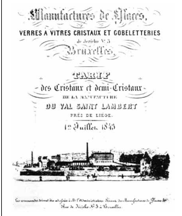
Abb. 2005-1/076 Musterbuch Val St. Lambert 1847 [1843], Einband Manufactures de Glaces, Verres à vitres Cristaux et Gobe- letteries ... Bruxelles, Tarif des Cristaux et demi-Cristaux de la Manufacture du Val Saint Lambert près de Liège 1 er Juillet 1843 Sammlung Museum du verre, Liège aus AK Glaskunst in Wallonië, S. 38, Abb. 44