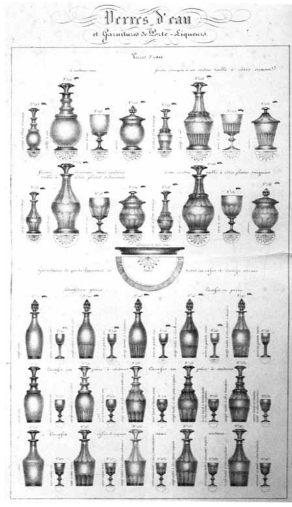
Abb. 2005-1/072 MB Val St. Lambert 1839, Titel u. I. Partie, Pl. 6 Verres d'eau et Garnitures de Porte - Liqueurs Engen 1989, Het glas in België, S. 262 s.a. AK Glaskunst in Wallonië, S. 25 ff., Abb. 20 - 22