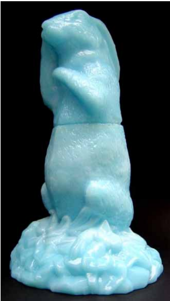
Abb. 2005-1/645 Aufgerichteter Hase als Deckeldose opak-hellblaues Glas, H 19,5 cm, D Sockel 11,5 cm Sammlung Christoph ohne Marke, Hersteller unbekannt, Deutschland?, um 1900

Bisher konnte kein Sammler den Hersteller für diese Osterhasen-Dose finden. Obwohl der Hase auch in den USA aufgetaucht ist, z.B. bei Chiarenza, ist der Hersteller sicher in Europa, in Frankreich, Belgien oder Deutschland zu suchen.