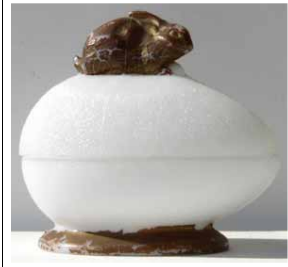
Abb. 2005-1/649 Deckeldose als Hase auf einem Ei opak-weißes Glas, goldene Kaltbemalung H 11 cm, L 12 cm, Sammlung Geiselberger PG-620 vgl. Sammlung Fehr, s. Abb. 2004-1/365 u. 2004-1/366 innen gemarkt „VALLERYSTHAL“, Vallérysthal, um 1900