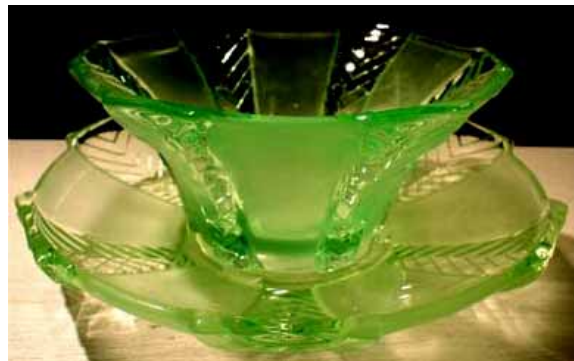
Abb. 2005-1/335 a/b eBay England, Art.Nr. 3779197451, €27,70 "Art Deco green glass dish & plate set ... Vaseline/Uranium green glass ... Produced by August Walther & Söhne in the 1930's, ... 'Athene Pattern' ... featured in their 1934 product catalogue (see picture below) ...", Schale H 5 cm, D 12 cm, Teller D 15 cm

sieht man bei der Vase „Athene“ (siehe unten): bei „Athene“ original / alt waren Fischgrät-Muster und Füße matt und nicht wie hier umgekehrt! (MB Walther 1934, Tafel 14, „Service clear and with matted etched borders / .. mit matten geätzten Bändern ... Lieferbar in den Farben weiß, azurblau, rosé, [uran-]grün, rauchtogas, bernstein“) Die in eBay angebotene Schale „Athene“ ist also nicht von Walther 1934, sondern von VEB Sachsglas 1948-1965!