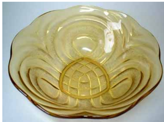
Abb. 2005-1/333 a/b eBay England, Art.Nr. 3780784475, € 14,50 "Art Deco amber glass bowl/dish ... August Walther & Söhne in the 1930's ... 'Rotterdam Pattern' ... featured in their 1935 product catalogue (see picture below)", H 7,5 cm, D 22,5 cm