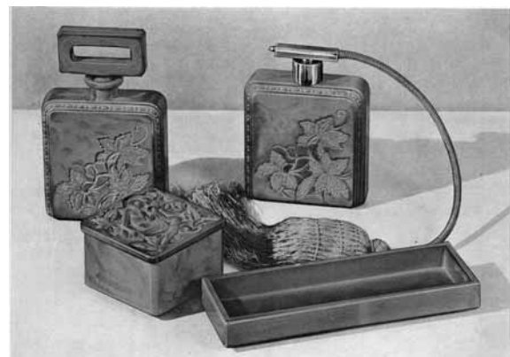
Toilette-Garnitur in jade und lapis

Abb. 2001-03/620 Musterbuch Schlevogt 1939, Seite 19 Toilette-Garnitur in jade und lapis, Nr. 11 Putten-Toilette-Garnitur in jade und lapis, Nr. 180 Sammlung Ingrid Schlevogt vgl. Riedel 1991, S. 96, Nr. 186, Riedel 1994, S. 140, Nr. 265, nach 1930, Lapis-Glas, gepresst u. nachveredelt, „Produktion Josef Riedel, Polaun, für die Kollektion „Ingrid“ der Firma Curt Schlevogt, Gablonz“