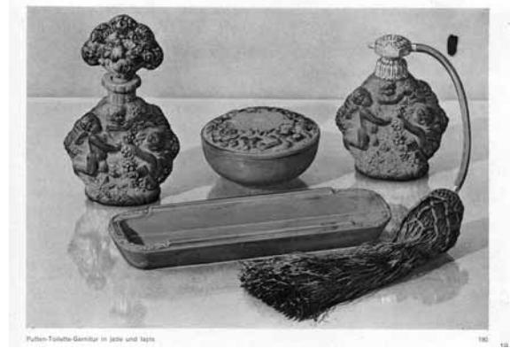
Putten-Toilette-Garnitur in jade und lapis

2. Spiegel und Bürste, Jadeglas: Spiegel 37 cm lang, Glaseinsatz, Durchmesser 15 cm, Bürste 27 cm lang, der ovale Glaseinsatz mit Höhe 11 cm und Breite 7 cm