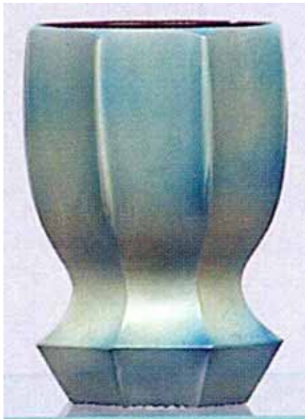
Abb. 2005-2/483 "Becher, rot-welsches Glas, außen mit blau-grüner Marmorierung, eingezogene Wandung mit Facettenschliffen, ausgestelltem Sockel und geschliffenem Strahlenkranz auf Stand, H 10 cm Friedrich Egermann, Blottendorf, 2. Hälfte 19. Jhdt." Schätzpreis € 450-700 aus Auktions-Katalog „Glas und Porzellan“, 2003-03, Dorotheum, Wien, S. 30, Nr. 90