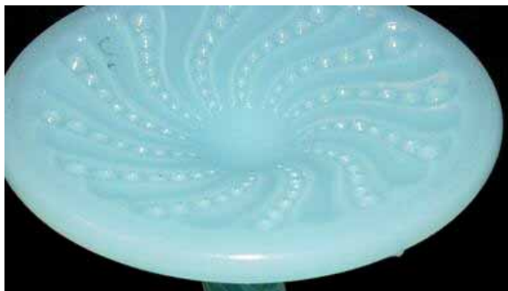
Abb. 2005-2/489 Teller mit geschwungenen Walzen und Perlen Rand mit großen und kleinen Bögen sehr helles blaues Pressglas, H 2,5 cm, D 15,7 cm Sammlung Siegmar Geiselberger PG-426 Teller mit geschwungenen Walzen und Perlen Rand mit großen und kleinen Bögen farbloses Pressglas, H 2,4 cm, D 20,3 cm Sammlung Geiselberger PG-732 vgl. MB Leerdam 1906, Plaat 33, Schale Nr. 1782