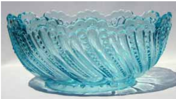
Abb. 2003-4-05/017 (Ausschnitt) Musterbuch Leerdam 1910, Tafel 25 / 20, Moulded Dishes

N.V. GLASFABRIEK „LEERDAM“ VOORHEEN JEEKEL, MIJNSSSEN & Co. - LEERDAM, HOLLAND.