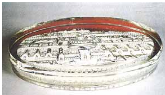
Abb. 2001-4/043 Paperweight „Rotunde“ zur Wiener Weltausstellung 1873 rechteckiges, farbloses Glas, Relief von hinten vergoldet H 2,2 cm, L 11,2 cm, B 7,2 cm Sammlung Stopfer seitlich eingepresste Marke „PATENT G S & C.“ Glashütte AG vorm. Gebr. Siegwart & Co., Stolberg b. Aachen, 1873