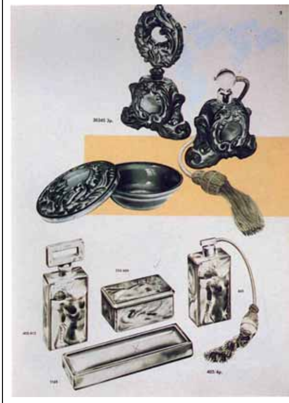
Abb. 2003-4-06/005 MB GLASSEXPOR „Ingrid“ um 1960, Tafel 5

Zur Verwirrung trägt tatsächlich bei, dass auf der Frontseite ein Etikett „INGRID“ und auf der Unterseite ein