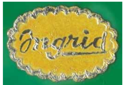
Abb. 2005-3/328 Flakon und Stöpsel mit Ranken-Dekor opak-jadegrünes Pressglas, H xxx cm, B xxx cm Sammlung Lorenz Klebeetikett „INGRID“ Klebeetikett „MADE IN CZECHOSLOVAKIA“ auf der Unterseite s. MB Glassexport Jablonec glass, um 1952, Tafel 31, Toilettenset, Nr. 30345

Wie lange existierten die Tschechischen Glasbetriebe eigentlich als privates Unternehmen?