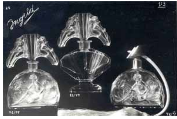
Abb. 2001-03/703 Musterbilder Schlevogt 1939, Bild 1, Flakon „Fische“ mit Stopfen „Kniende Nackte“ 13/14, opakes Glas, Ingrid Sammlung Ingrid Schlevogt