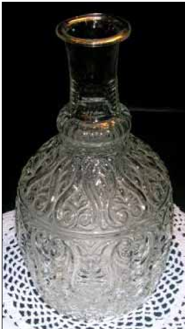
Abb. 2006-1/067 eBay Österreich, Art.Nr. 7374725007, Aufruf € 150, kein Gebot "Freudenthal Biedermeierflasche um 1840. Farbloses, form-geblasenes Glas mit Formnähten - Freudenthal um 1840, Oberösterreich ", H 25 cm, B 14 cm SG: Hersteller unbekannt, Böhmen oder Steiermark, um 1850

Die Karaffe hatte einen Anfangspreis von 150 €. Außerdem hatte der Händler gleich noch drei weitere form-geblasene Gläser aus „Freudenthal“ im Angebot.