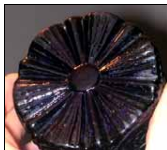
Abb. 2000-5/175 Schnapsflasche, sog. „Tschuttera“ mit „Reliefverzierung“ farbloses, form-geblasenes Glas, H 19,5 cm aus Eibiswald 1978, Abb. 73 Glashütte Staritsch / Ferdinandsthal, Steiermark, um 1820