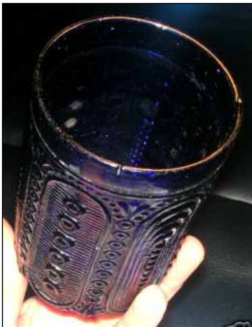
Abb. 2006-1/069 eBay Österreich, Art.Nr. 7374691797, Aufruf €90, €99,00 "Biedermeierglas in Kobaltblau um 1840. Kobaltblaues, form-geblasenes Glas mit Formnähten, H 11 cm, B 7 cm - Freudenthal um 1840, Oberösterreich " SG: Hersteller unbekannt, Böhmen oder Steiermark, um 1850

Aber bisher werden Gläser mit diesen Mustern von den Glashistorikern der Sammlung des Joanneums in Graz vor allem den Glashütten in der „Südsteiermark“, heute Slowenien, zugeschrieben!