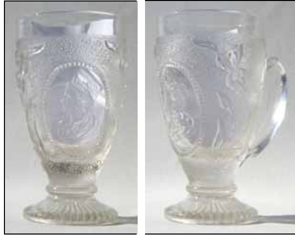
Abb. 2000-5/104 Senfbecher mit Kleeblatt-Dekor und wagrechten Rippen Portrait Königin Wilhelmina der Niederlande mit Diadem farbloses Pressglas, H 11,5 cm, D 6,3 cm, 3 Formnähte im Fuß Pressmarke „E im Stern“ Rheinische Glashütten AG, Ehrenfeld b. Köln, um 1900 Sammlung Geiselberger PG-424 vgl. Baumgärtner 1981, Abb. 373, „Holland, um 1898“ vgl. Kley 1999, S. 27, Abb. 13, der Becher „Koningin Emma“ wurde auch in Leerdam gefertigt s. MB Leerdam 1906, Plaat XLI, Geperste Mosterbekers

nicht gemarkt , entweder Rheinische Glashütten AG, Ehrenfeld b. Köln, um 1900 oder Leerdam, vgl. MB Leerdam 1906, Plaat XLI, Geperste Mosterbekers