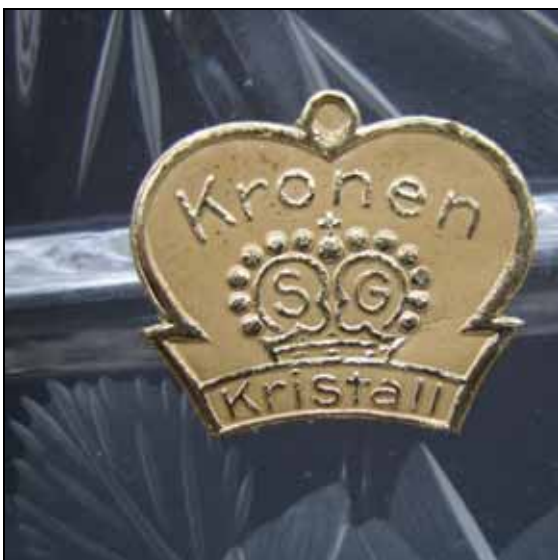
Abb. 2002-3-2/031 (Ausschnitt) Musterbuch Walther 1936, Tafel 27, Kronenkristall Traube, Excelsior, Rosen, Favorit, Blume, Rapid Service „Rosen“: Teller 53112 D 14,5 cm, 53140 D 29 cm Sammlung Mauerhoff

s. Abb. 2002-3-2/031, MB Walther 1936, Tafel 27, Kronenkristall, Service „Rosen“: Schale 53140 D 29 cm Sammlung Mauerhoff, Sächsische Glasfabrik August Walther & Söhne, Ottendorf-Okrilla, um 1935/1936