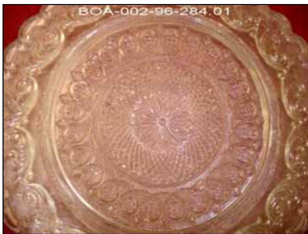
Abb. 2006-3/123 rechts Prato em cristal lapidado [Teller aus Kristallglas gesteinelt] D 20,5 cm Vista Alegre 1824-1880 Katalog Cristais e vidros ohne Datum, S. 23, Kat.Nr. 24 €300 - 450 vgl. MB Launay & Hautin, um 1840, Planche 45, No. 1705 Assiette à dessert, m. sablée et guirlande (S.L.), St. Louis