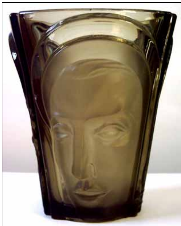
Abb. 2006-3/390 Vase mit drei Gesichtern (Mutter, Vater, Sohn) rauch-graues Pressglas / „rauchtopas“, H 18,3 cm, D 16 cm Sammlung Bateman s. MB Walther 1934, Tafel 86, Vase Nr. 42950, „Relief“