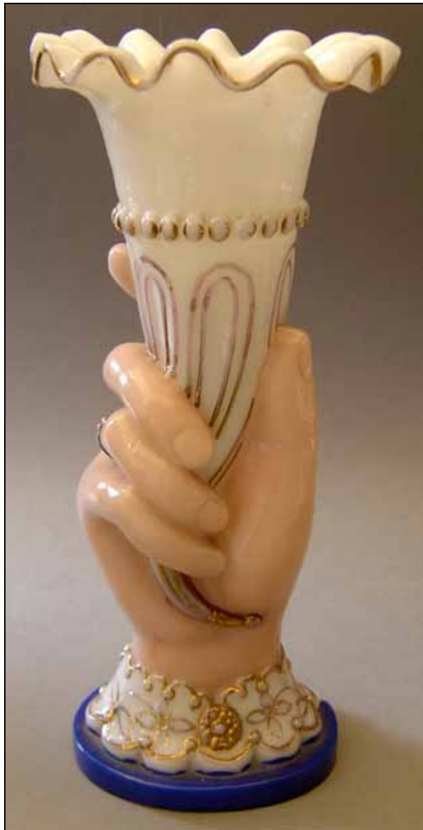
Abb. 2006-3/201 Rechte Hand mit Füllhorn opak-weißes, press-geblasenes Glas, bunt bemalt Sammlung Christoph s. MB Portieux 1914, Planche 9, Nr. 7853

Vasen mit Händen konnte man schließlich schon ganz traditionell in Holzformen blasen, bevor man Glas mit Pressluft blasen konnte. Auch als die Herstellungstechnik weiter entwickelt war, konnte man Handvasen weiter nur in eine Form blasen, dann aber aus Metall, um eine größere Anzahl aus der selben Form zu machen.