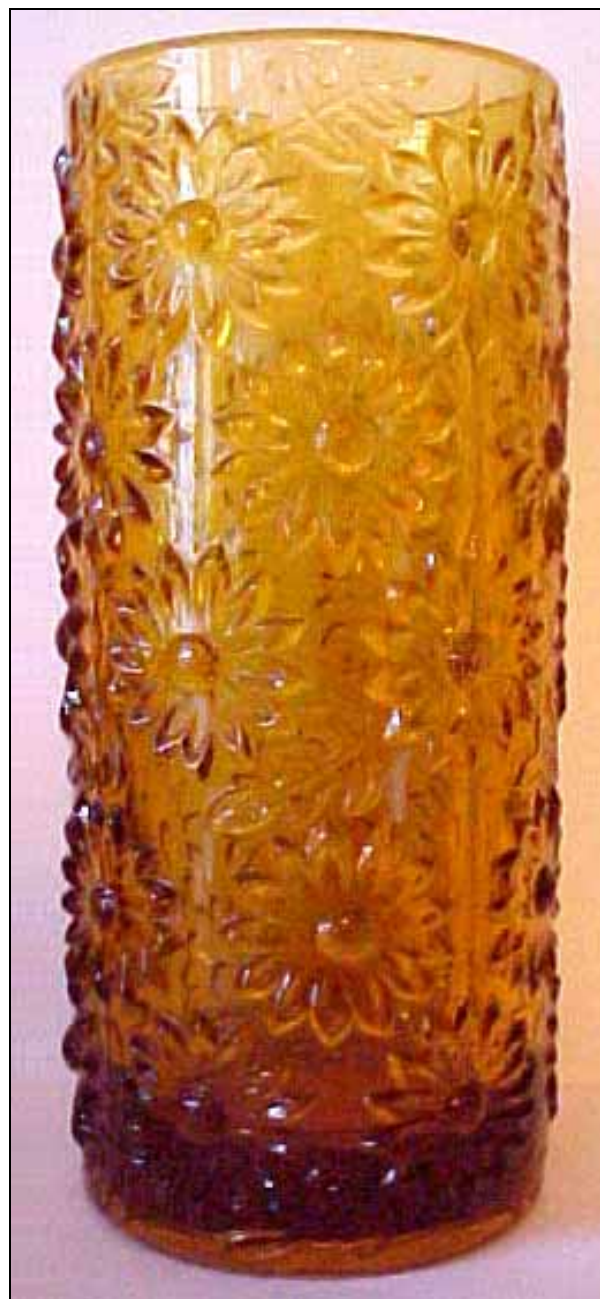
Abb. 2006-3/309 Vase mit Blüten, No. 1619/M/14, 19 und 25 cm Entwurf Rudolf Jurnikl, 1974, Rosice Works of Sklo Union vgl. Abb. 2006-1/315, Dose mit Blüten, blaues Pressglas Sammlung Newhall, ohne Marke vgl. MB Barolac 1949/1952, Tafel B 4, Nr. 11586