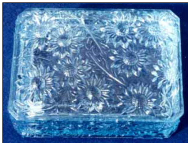
Abb. 2006-1/315 Dose mit Blüten blaues Pressglas, H xxx cm, B xxx cm, L xxx cm Sammlung Stopfer ohne Marke s. MB Barolac 1949/1952, Tafel B 4, Nr. 11586

The image I have attached is that of a vase, credited to Rudolf Jurnikl, design year 1974, and Rosice pattern number 1619/M/190.