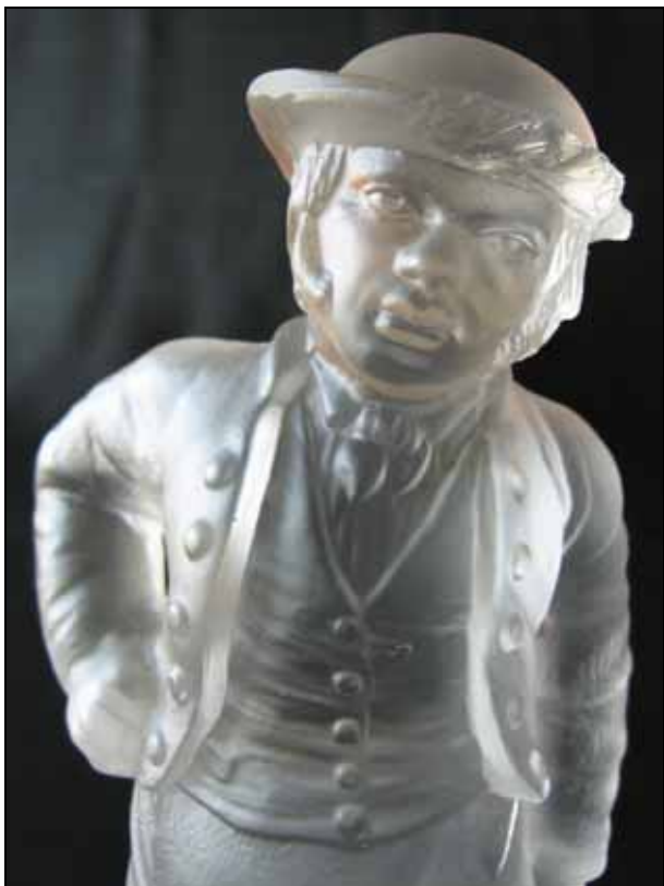
Abb. 2006-4/068 Figur als Bauer farbloses Pressglas, mattiert, H 19,5 cm, D xxx cm St. Louis 1872 s. MB Saint Louis, um 1872, 1 re Partie, Planché ohne Nummer [Nr. 3], Moulure, No. 1, statuette dépolie