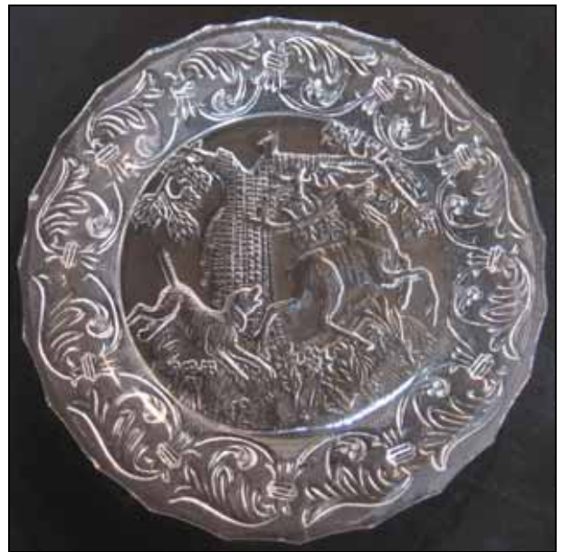
Abb. 2004-1/075 Teller mit Jagdszene - Hirsch und Hund vor einem Baum Rand mit 7 x 2 Blumenbuketts im Wechsel farbloses Pressglas, H 2,5 cm, D 22,3 cm Sammlung Vogt Hersteller unbekannt, vielleicht Reijmyre, 1850-er Jahre

Abb. 2007-2/068 Teller mit Jagdszene - Hirsch und Hund vor einem Baum Rand mit Girlanden, farbloses Pressglas, D 16,5 cm, G 325 g Sammlung Vogt Hersteller unbekannt, vielleicht Reijmyre, 1850-er Jahre