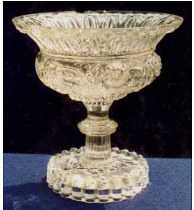
Abb. 2002-5/159 und Abb. 2002-5/160 Zuckerschale farbloses, form-geblasenes Glas H 13 cm, D oben 13,1 cm, D unten 8,5 cm Sammlung Stopfer Hersteller unbekannt, Böhmen oder Mähren, nach 1850