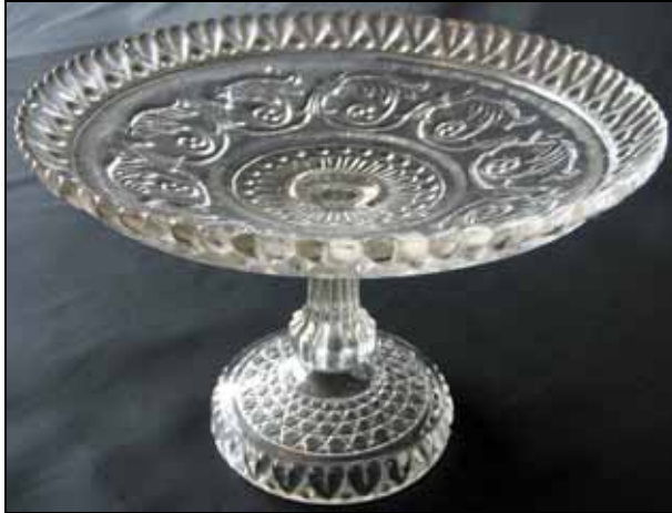
Abb. 2007-2/070 Fußschale mit Girlanden, Rand mit herz-förmigem Dekor farbloses Pressglas, H 15,5 cm, D 22,5 cm Sammlung Vogt Hersteller unbekannt, vielleicht Reijmyre, 1850-er Jahre

Ich glaube nicht, dass Reijmyre diese Fußschale mit Girlanden gemacht hat: PK 2007-2, Abb. 2007-2/070.