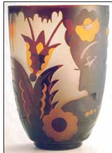
Abb. 2007-3/376 (siehe nächste Seite)

MB Sammlung Museum Valašské Meziříčí Inv.Nr. 92/03