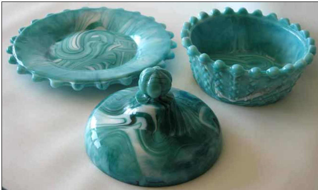
Abb. 2007-3/170 Butterdose mit Teller mit Rippen aus Diamanten opak grün-weiß marmoriertes Pressglas, Teller D 18,4 cm, Schale H 5,3 cm, D 13,5 cm, Deckel H 7,0 cm, D 11,8 cm Sammlung Vogt ohne Marke, s. MB J. Schreiber & Neffen AG, 1915, Tafel 78, Nr. 1546