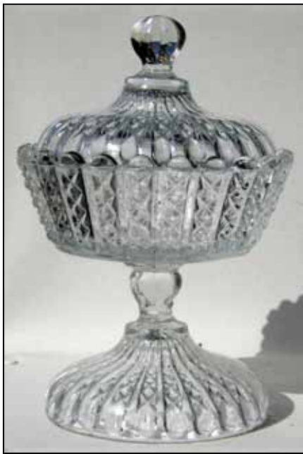
Abb. 2005-3/260 (Detail)

ohne Marke, wahrscheinlich Schreiber & Neffen, um 1900 vgl. MB Schreiber & Neffen 1889, Tafel 32, Teller Nr. 1540 vgl. MB Stölzle 1920, Tafel 33, Service ohne Namen, Zuckerdose mit Deckel Nr. 2057, vgl. auch MB Stölzle 1925, Tafel 19, Garnitur mit Brillantpressung, Nr. 2057 PK 2006-4, SG: vgl. MB Pressglas Schreiber 1915, Tafel 78, Zuckerdose Nr. 1546