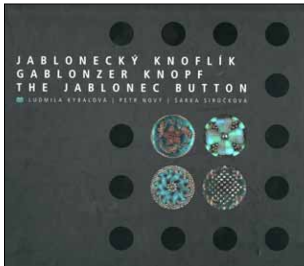
Abb. 2007-4/232 Ausstellungskatalog „Jablonecký knoflík - Gablonzer Knopf - The Jablonec Button“ Muzeum skla a bižuterie, Jablonec nad Nisou 2007, Einband