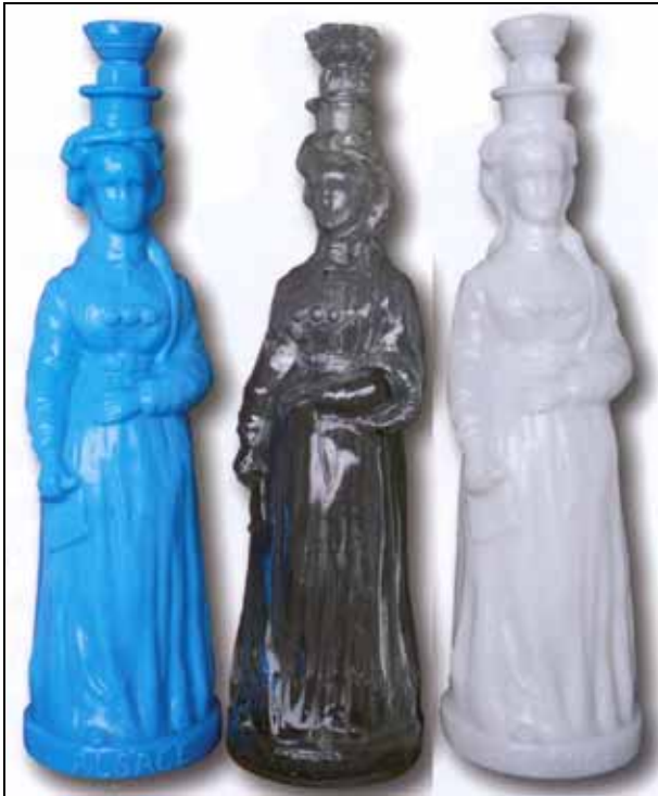
Abb. 2008-1/198 Flaschen „ALSACE“ opak-blaues, -graues bzw. -weißes Glas, H 37 cm gemarkt „D & D“, für Delizy & Doisteau, Paris-Pantin aus Wagner, Bouteilles à sujet, Paris? 2007, S. 123, Abb. 260

Bisher wurden weder im Buch Michel ..., Legras verrier, Puteaux 2002, noch in Wagner, Les bouteilles à sujet, Paris? 2007, Hinweise auf die Markierung der Flaschen von Legras gegeben. Auf einem Briefbogen von Legras wird als Marke angegeben: „MARQUE DE FABRIQUE DÉPOSÉ“ mit einem Oval und darin eine Henkelkanne mit Stopfen sowie „S T DENIS (Seine)“.