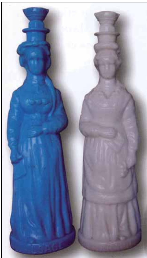
Abb. 2008-1/196 Flaschen „ALSACE“ und „LORRAINE“ opak-blaues bzw. -weißes Glas, H 37 cm gemarkt „D & D“, für Delizy & Doisteau, Paris-Pantin Hersteller unbekannt, wohl Legras & Cie., Paris-Pantin aus Wagner, Bouteilles à sujet, Paris? 2007, S. 101, Abb. 195

Nach dem Deutsch-Französischen Krieg 1870/1871 und der Annektion von Teilen Elsass-Lothringens durch das Deutsche Reich wurden auch patriotische Motive verwendet. Die wichtigsten Flaschen sind zwei Frauen in Volkstracht „ ALSACE “ [Elsass / Elsaß] und „ LORRAINE “ [Lothringen]. Bei vielen Flaschen wurde diese Bezeichnung im Sockel eingepresst. Diese beiden Flaschen trugen außerdem manchmal die Bezeichnung „ COURAGE “ für „LORRAINE“ bzw. „ ESPOIR “ für „ALSACE“ [Mut bzw. Hoffnung] auf den Urkunden in ihrer rechten Hand.