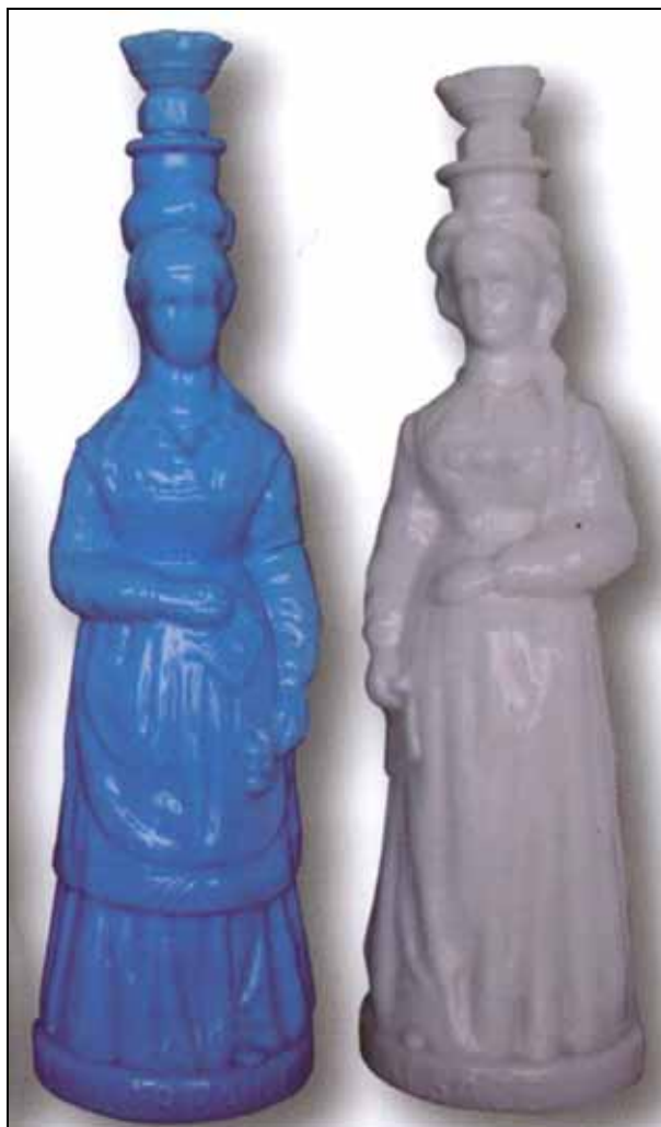
Abb. 2008-1/197 Flaschen „LORRAINE“ und „ALSACE“ opak-blaues bzw. -weißes Glas, H 37 cm gemarkt „D & D“, für Delizy & Doisteau, Paris-Pantin Hersteller unbekannt, wohl Legras & Cie., Paris-Pantin aus Wagner, Bouteilles à sujet, Paris? 2007, S. 101, Abb. 195

Die Trachten unterscheiden sich: die Elsässerin hat auf ihrem Busen drei Bollen und trägt keinen Schurz, die Lothringerin trägt ein Überkleid und einen Schurz. Die Kopfbedeckungen sind nicht gut zu erkennen. Die Elsässerin scheint eine Haube mit großen Schleifen zu tragen, die Lothringerin ein Kopftuch.