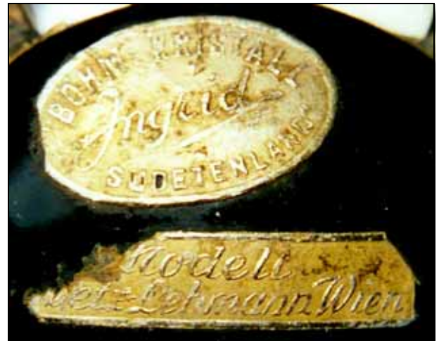
Abb. 2001-03/654 Musterbuch Schlevogt 1939, „Madonnen ...“, Seite 4 Madonnenkopf Nr. 853, Christuskopf Nr. 427 Modelle: Prof. Plewa, Gablonz a. N. Madonnen-Maske Nr. 944, Christi-Geburt Nr. 827 Modelle: Schwetz-Lehmann, Wien