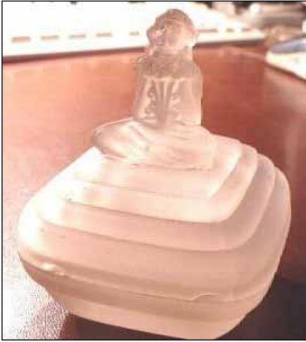
Abb. 2005-4/225 eBay Frankreich, Art.Nr. 6570104208, € 53,99 "Boite ancienne en verre presse-moule à décor de danseuses dans le gout de l'antique, dans les annees 1930 ... Art Déco. Ces personnages tiennent des guirlandes de fleurs. On attrape le couvercle par un angelot ailé avec les mains dans le dos" H xxx cm, D xxx cm, L xxx cm SG: Hersteller unbekannt s. MB Mau-Riel, Lyon, um 1925, Planche o.Nr., Nr. 6143, Dose „Empire“