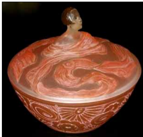
Abb. 2005-2/499 eBay Frankreich, Art.Nr. 6520380313, € 77,00 "Bonbonnière, boîte à poudre, en verre pressé-moulé, patiné ocre-rouge, époque art déco, signée en relief MAU-RIEL " H xxx cm, D 14,3 cm s. MB Mau-Riel, Lyon, um 1925 (s. Frisur Herrenschnitt!) Planche o.Nr.,Nr. 6177, Dose „La Garçonne“