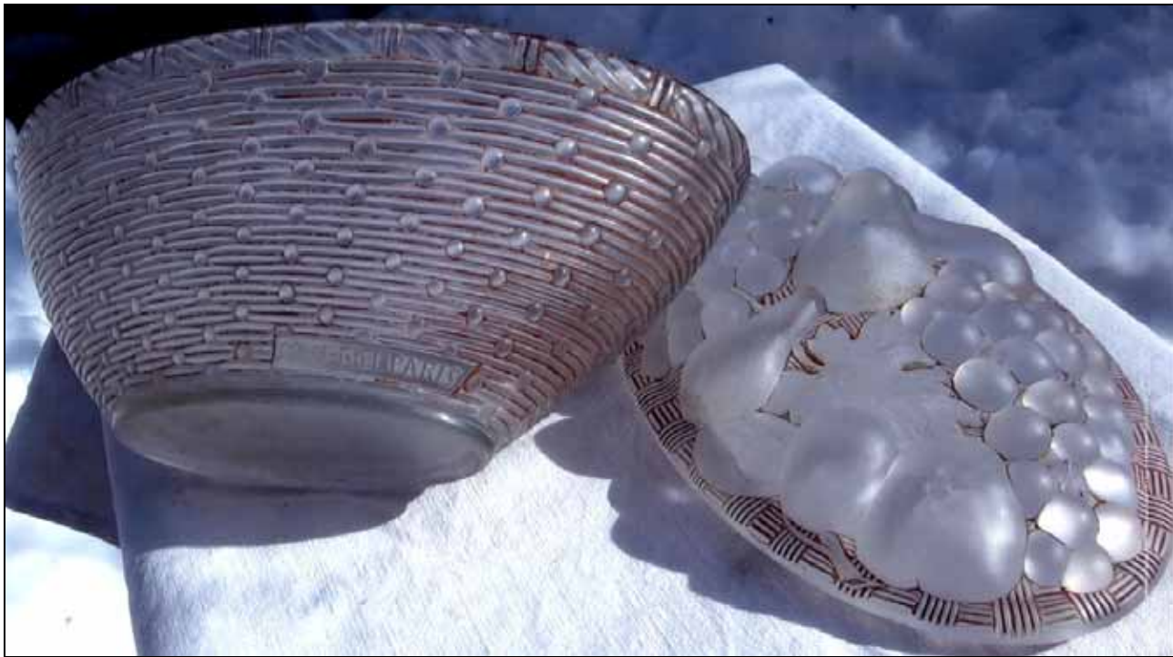
Abb. 2009-1/284 Deckeldose als Korb mit Früchten, farbloses, fein mattiertes Pressglas, teilweise patiniert, H 16,5 cm, B 14 cm, L 25 cm Sammlung Handiak-Christophe, eingepresste Marke „MAU-RIEL PARIS“ Hersteller unbekannt, s. MB Mau-Riel um 1925, Tafel o.Nr., Dosen 1, ohne Nr., Dose „Corbeille à fruits“