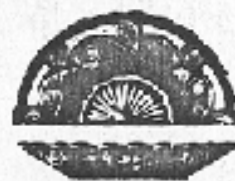
Nr. 74. Zuckerteller