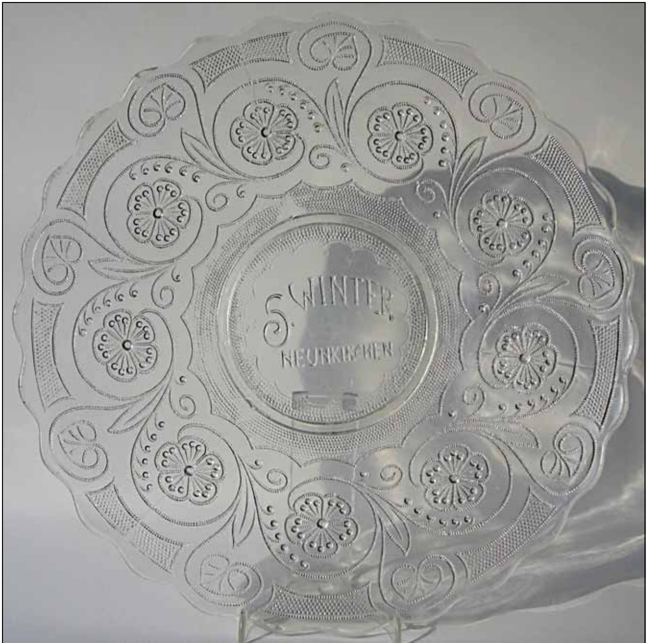
Abb. 2009-1/231 (Maßstab ca. 50 %) Teller mit Blüten und Ranken aus feinen Punkten, eingepresst „S. Winter - Neunkirchen“ farbloses Pressglas, H 3,5-3,8 cm, D 32 cm Sammlung Geiselberger PG-1149 s. MB Fenne 1909/1910, Tafel 11, Preßglas-Service Diana, s.a. Nest, Glas und Ton für Kunst und Lohn, 2001, S. 206, Abb. 15