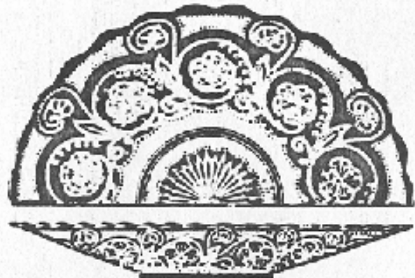
Nr. 70. Teller, tiefe Form

Nr. 1 2 2 1/2 3 3 1/2 4 4 1/2 Durchm. 235 260 175 160 120 110 100 mm