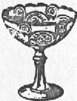
Nr. 71. Zuckerschale

Nr. 1 2 2 1/2 3 3 1/2 4 4 1/2 Durchm. 315 265 250 200 155 145 110 mm