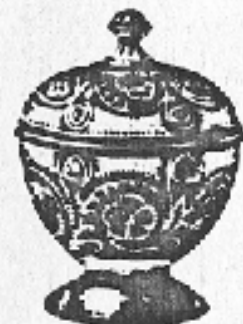
Nr. 73. Zuckerdose