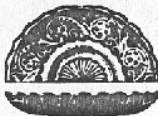
Nr. 72. Teller, Schälform