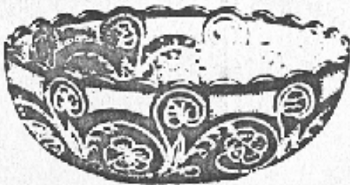
Nr. 69. Compotier

Nr. 1 2 2 1/2 3 3 1/2 4 4 1/2 Durchm. 235 260 175 160 120 110 100 mm