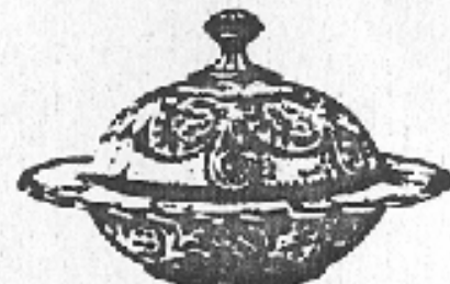
Nr. 76. Butterdose