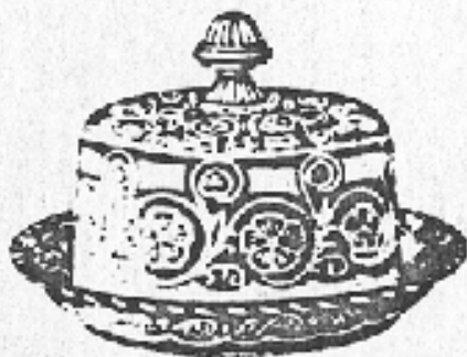
Nr. 75. Käseglocke