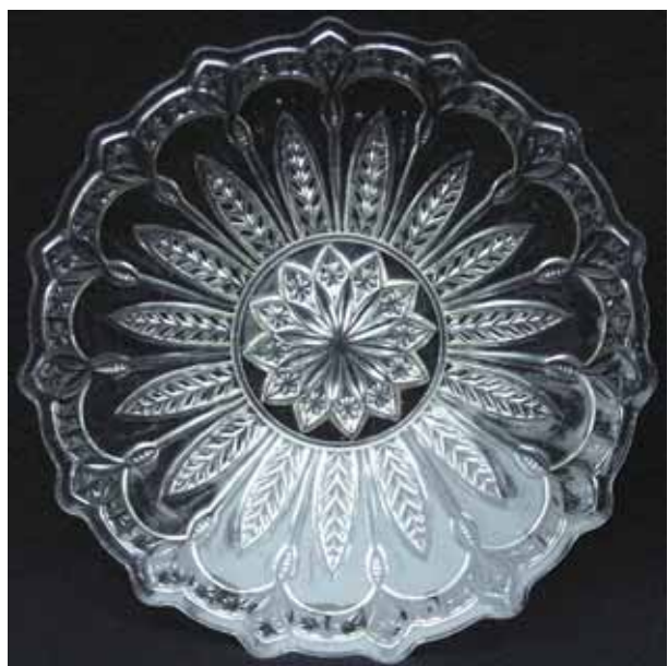
Abb. 2009-1/149 (Maßstab ca. 40 %) Teller, Dekor 15 Blätter, Rand mit 15 Bögen und 15 Rauten Bodenstern mit 12 Rauten farbloses Pressglas, H 3,5 cm, D 20,5 cm Sammlung Geiselberger 2002 Hersteller unbekannt, Deutschland?, um 1900?