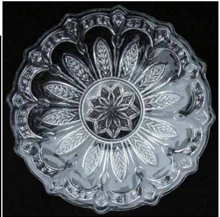
Abb. 2009-1/146 (Maßstab ca. 62 %)

kleiner Teller, Dekor 12 Blätter, 24 flache Randbögen, Fahne mit 12 Bögen und 12 Rauten, farbloses Pressglas, H 1,9 cm, D 12 cm kleiner Teller, Dekor 12 Blätter, Rand mit 12 Bögen und 12 Rauten, Bodenstern mit 9 Rauten, farbloses Pressglas, H 2,1 cm, D 14,5 cm Sammlung Geiselberger 2002 Hersteller unbekannt, Deutschland?, um 1900?