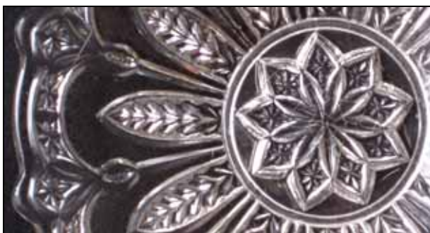
Abb. 2009-1/147 (Maßstab ca. 62 %)

Die Rauten am Rand der Teller bzw. auf der Fahne der Teller sind genau betrachtet keine Rauten, sondern Spitzovals mit einem 8-strahligen Stern, die mit den schmalen Spitzovals unterhalb und mit den Stielen zwischen den Blättern stilisierte Blüten mit Stengeln bilden. Das Motiv der Fahne mit Bögen und Rauten wird bei den größeren Tellern zum Rand verschoben, die flachen Bögen der kleinen Teller verschwinden. Die Blätter werden dann nicht mehr durch einen Ring / Bodenring geteilt. Insgesamt sind alle Details so gestaltet, dass man sie auch schleifen könnte, aber eben nur mit einem sehr großen Aufwand. Auf den größeren Tellern und Schüsseln wurde dieses Motiv durch Feuerpolieren stark geglättet. Bei den kleineren Tellern sind die Kanten schärfer geblieben. Vollständig mit allen Teilen wurde durch die hohe Qualität der Pressung und Nachbearbeitung sowie durch die hohe Brillanz der Glasmasse eine prächtige, kostbare Garnitur angeboten.