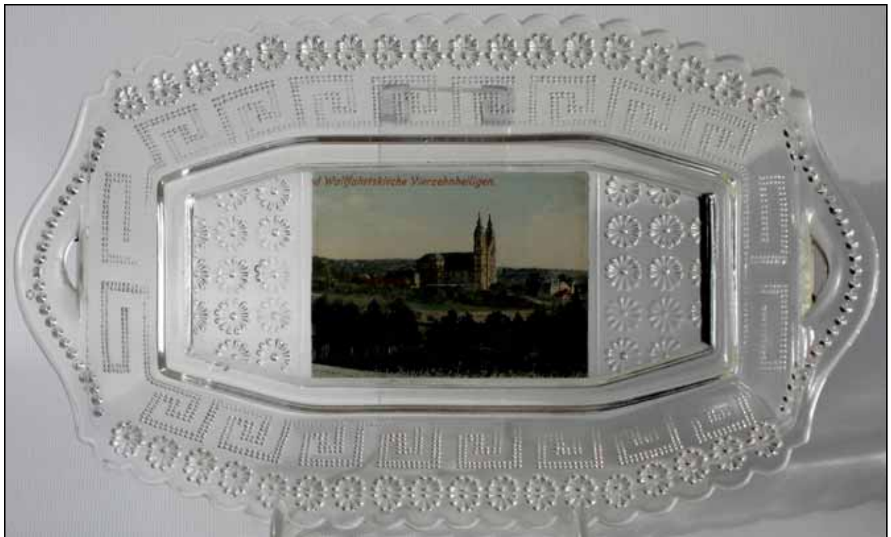
Abb. 2009-1/229 (Maßstab ca. 75 %) Tablett mit Rosetten und Mäander, Foto „Wallfahrtskirche Vierzehnheiligen“ farbloses Pressglas, H 2,7 cm, B 13,2 cm, L 22,1 cm Sammlung Geiselberger PG-1148 s. MB Gebrüder von Streit 1913, Tafel 11, Nr. 13, Teller „Berlin“ oblong mit 2 Griffen, Länge 220 mm