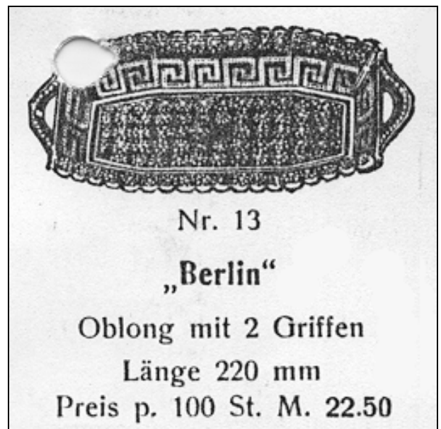
Abb. 2001-1/413 (Ausschnitt) MB Gebrüder von Streit, 1913, Tafel 11, Nr. 13 Teller „Berlin“, Oblong mit 2 Griffen, L 22 cm MB Sammlung Feistner

leur viel länger gebraucht als mit dem Körner. Ein Metallbohrer hat auch heute noch nicht so eine scharfe Spitze wie ein Körner.