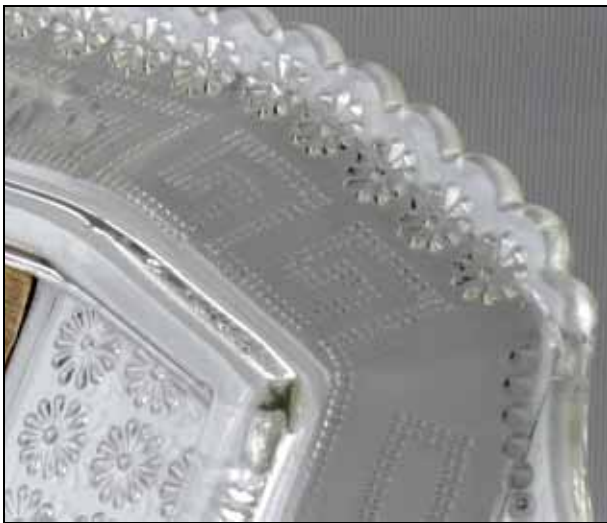
Abb. 2009-1/230 Tablett mit Rosetten und Mäander, Rückseite Foto „Wallfahrtskirche Vierzehnheiligen“ farbloses Pressglas, H 2,7 cm, B 13,2 cm, L 22,1 cm Sammlung Geiselberger PG-1148 s. MB Gebrüder von Streit 1913, Tafel 11, Nr. 13, Teller „Berlin“ oblong mit 2 Griffen, Länge 220 mm

Zu den Bildern unten und rechts: leider konnte ich die oben beschriebene Scharfkantigkeit nicht fotografieren.