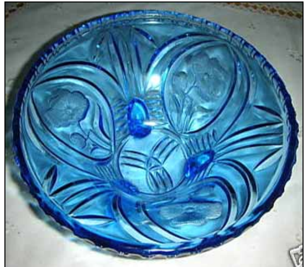
Abb. 2009-1/272 eBay DE, Art.Nr. 140288271162, € 1,00, kein Gebot Art.Nr. 140290100052, € ??? hellblaue Kristallschale auf drei Füßen - sie hat keinen Kristallschliff, sondern ist aus Pressglas" H 10 cm, D 22 cm SG: s. MB Walther 1935, Tafel 180 und 181, Nr. 45957, D 15 cm, Nr. 45959, D 22 cm, Brandenburg mit Blüten

eBay DE und Wessendorf Nr. 07818 wurden die Eichenblätter auf der Außenseite mattiert, entweder geätzt oder sand-gestrahlt, bei der Schale Rühl & Sadler sind die Eichenblätter blank.