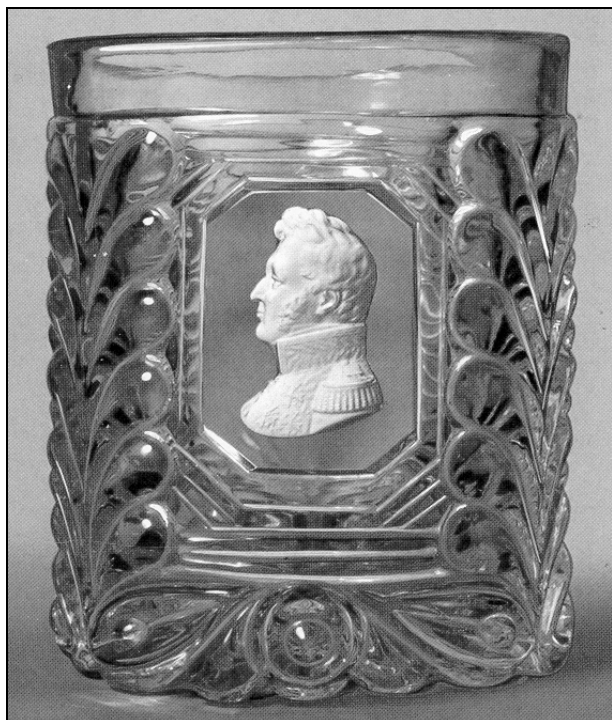
Pressglas -Becher mit eingeglaster Paste in achteckigem Feld Louis Philippe von Frankreich aus Baumgärtner 1981 , Abb. 244, H 9,7 cm Frankreich, Saint Louis, nach 1830 (s.u. Literaturangaben)

Abb. 2000-3/090 a Becher mit Pasten-Portrait Louis Philippe aus Baumgärtner 1971 , Nr. 259 und S. 347 „Boden mit Walzenstern. Zylindrische Wandung in sechs Zonen vertikal unterteilt: abwechselnd Rundblattrispen und Horizontalrippen in Walzenschliff . Auf der Vorderseite hochrechteckiges Feld mit eingeglastem Pasten-Portrait des Bürgerkönigs Louis Philippe. Abgesetzter Lippenrand.“ H 9,7 cm Frankreich, Saint Louis, nach 1830 vgl. Schenk zu Schweinsberg 1970, S. 72, Abb. 347 „St. Louis, um 1830 Sammlung Heine, Badisches Landesmuseum, Karlsruhe“ vgl. Klesse, Sammlung Krug 1965, Nr. 396