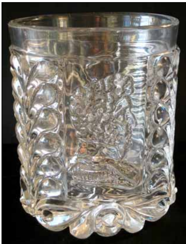
Abb. 2009-1/059 Becher mit Reliefportrait König Louis Philippe (reg. 1830-1848) gepresstes Bleikristallglas, H 9,6 cm, D 8,1 cm Sammlung Vogt PV-527 St. Louis, ab 1830

SG: König Louis Philippe regierte als „Bürgerkönig“ von 1830 bis 1848 , in der sog. „Juli-Monarchie“. 1848 wurde er durch die „Februar-Revolution“ gestürzt. 1825-1830 beginnt die hohe Zeit der ersten Pressglas-Produktion in Vonèche, Baccarat, St. Louis, Val St. Lambert und Louis Zoude , Namur. Mit dem Portrait des Königs gab es unzählige Becher und Gläser: geblasen und geschliffen, graviert, gepresst und mit eingeglasten Pasten. Man könnte meinen, dass der Hersteller leicht zu finden ist: entweder Baccarat oder St. Louis. In MB Launay, Hautin & Cie. um 1840 wer-