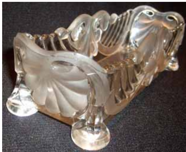
Abb. 2009-2/033 Schale mit Ranken-Muster farbloses, tlw. mattiertes Pressglas, H 6,5 cm, B 8 cm, L 24 cm Sammlung Groß eingepresste Marke „VALLERYSTHAL“ in bisher bekannten Katalogen Vallérysthal nicht gefunden