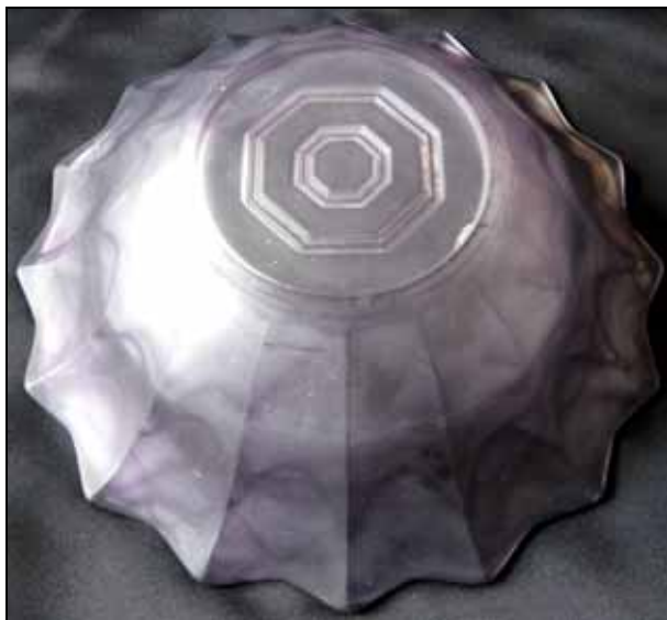
Abb. 2001-3/319 (Ausschnitt) MB Walther 1934, Tafel 12, Service Aphrodite Schale Nr. 43638, D 20 cm, Schale Nr. 43639, D 24 cm Teller Nr. 43634, D 14,5 cm, Teller Nr. 43635, D 29 cm MB Sammlung von Spaeth