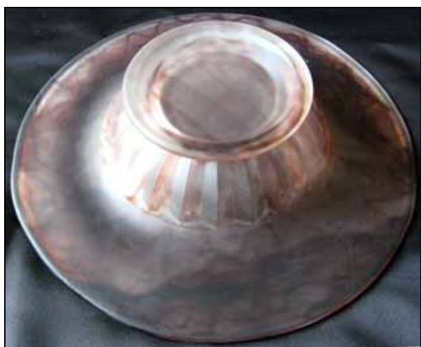
Abb. 2008-1/362 Schale „Prismen“ braun-marmoriertes Pressglas, H 6,5 cm, D 28 cm Sammlung Rühl & Sadler s. MB Walther 1932, Prospekt Achat-Kunstglas Oralit, Seite 2