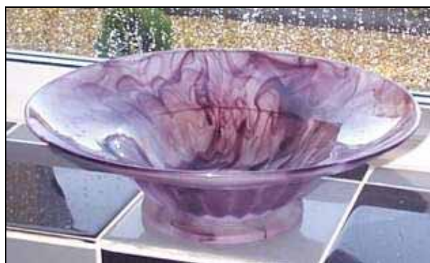
Abb. 2009-2/251 Davidson Pattern No: 1910 MD Known Cloud Colours: Amber, Blue, Purple, Green, Orange, Briar Size(s): 7.5 inches diameter Date Range: 1925(?) to 1942(?) Description: This three piece flower set consists of a 7.5 inch diameter bowl with turned over edge, a 3.5 inch dome flower block and a No 1 plinth (4 inch diameter). http://www.cloudglass.com/S1910.htm