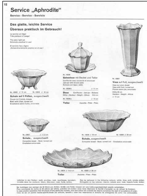
Abb. 2000-6/204 (Ausschnitt) MB Walther 1932, Prospekt Achat-Kunstglas ORALIT, Seite 2 Schalen Prismen SG: der breite, flache Rand wurde nach dem Pressen manuell mit einem Brett mehr oder weniger verformt MB Sammlung Mauerhoff