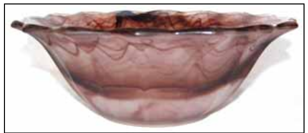
Abb. 2009-2/253 Walther Pattern Name: Aphrodite Known Cloud Colours: Sepia, Violet Size(s): 20 and 24 cm diameter Walther Catalogue No: Unknown [SG: MB 1934, Tafel 12, Service Aphrodite] Date Range: 1932(?) to 1940(?) Description: Circular bowl with rippled edge and an impressed octagonal design in the base. The catalogue numbers for the non-cloud colours are 43638 (20 cm) and 43639 (24 cm) http://www.cloudglass.com/Walbowl.htm