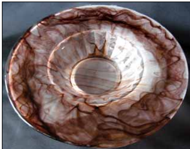
Abb. 2009-2/249 Schale mit breitem, flachem Rand und Rippen braun gewolkttes Pressglas, H 6,5 cm, D 28 cm Sammlung Michl s. MB Walther 1932, Prospekt Achat-Kunstglas ORALIT, Seite 2, Blumenschale „Prismen“ mit geradem Rand