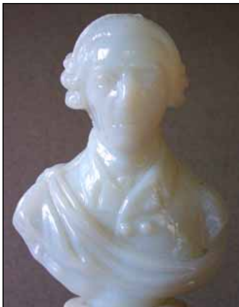
Abb. 2006-4/065 Flakon mit Büste „Washington (?)“ opak-weißes, form-geblasenes Glas Flakon mit Stopfen H 19 cm (7 ½“), Boden D 7,3 cm (2 7/8“) Sammlung Chiarenza Cristallerie de Bercy, um 1830

Die beiden Büsten hat Houdon nach dem Tod von Voltaire am 30. Mai 1778 und von Rousseau am 2. Juli 1778 als Paar geschaffen und angeboten - obwohl sie verfeindet waren - [s. http://www.metmuseum.org/toah/hd/jahd/ho_08.89.2a.htm ]. Daher ist es wahrscheinlich, dass auch die beiden Flakons „Voltaire“ und „Rousseau“ von der Cristallerie de Bercy um 1830 als Paar angeboten wurden - s.a. Teller Abb. 2005-2/213, nach 1818 / um 1830-1840.