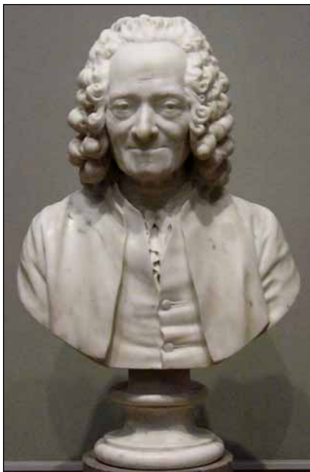
Abb. 2006-4/056 Voltaire Büste von Jean-Antoine Houdon, 1778, Slg. Thomas Jefferson aus http://explorer.monticello.org/text/index.php?id=1&type=4 SG: Kopie der Original-Büste - vgl. oben