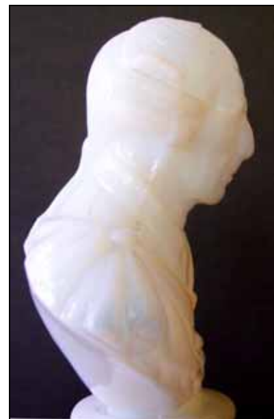
Abb. 2009-2/028 George Washington (1732-1799)