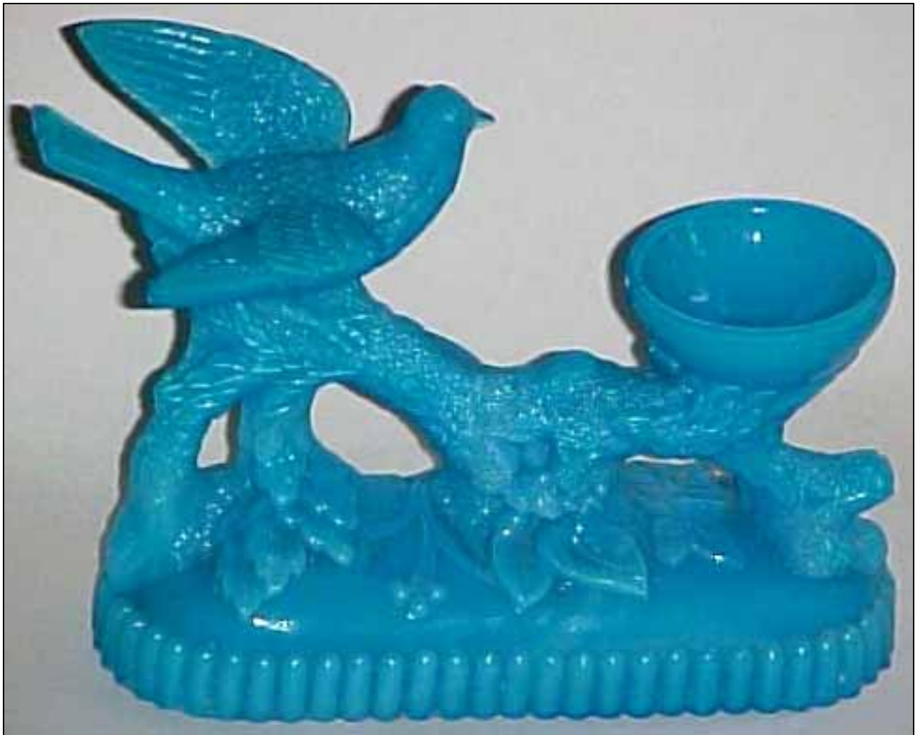
Abb. 2009-3/106 (Maßstab ca. 110 %) Vogel mit Schale auf einem Zweig, opak-blaues Pressglas, H 12,7 cm, B 5,4 cm, L 15,2 cm, Vogel B 8,2 cm, L 8,2 cm Sammlung Nicol s. MB Bayel & Clairey 1886, Planche 54, Coupes moulées, Corbeilles moulées, No. 381, „Vide-poches oiseau“