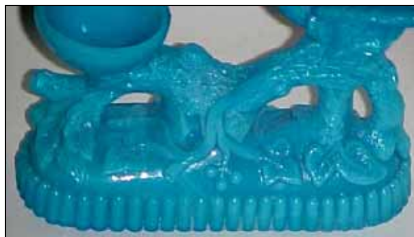
Abb. 2006-2-03/032 MB Bayel & Clairey Prix-Courant 1887, Seiten 24-25, Planches 52-58, Coupes moulées suite, Corbeilles moulées, Paniers...