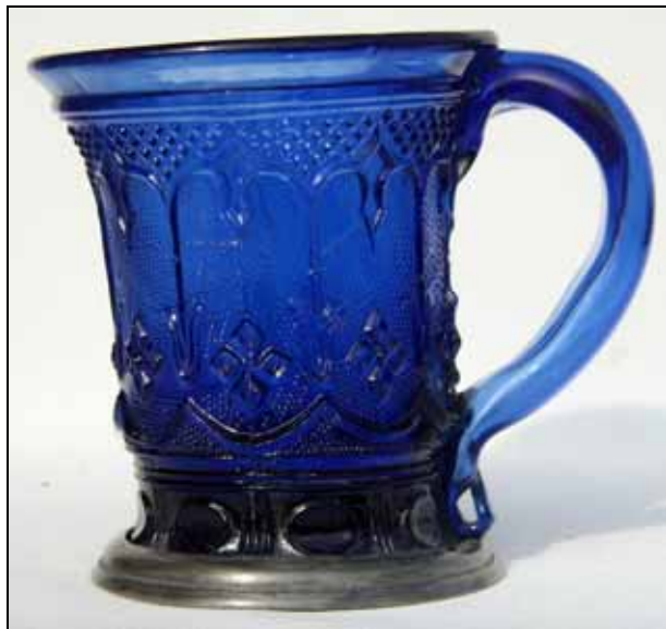
Abb. 2005-2/124 Henkelbecher mit neo-gotischem Dekor, Diamanten und Sablée dunkelblaues Pressglas, H 9,2 - 9,6 cm, D Rand 8,2 cm Montierung aus Zinn D 7,6 cm Henkel angesetzt, Abriss, 4 Formnähte, Rand feuer-polirt Sammlung Schaudig Hersteller unbekannt, Frankreich, um 1830, oder Böhmen, um 1850 vgl. Henkelbecher Sammlung Jargsdorf, Abb. 2000-2/254c