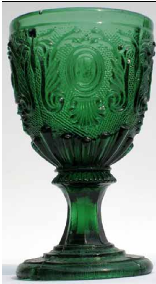
Abb. 2009-3/071 (Maßstab ca. 100 %) Fußbecher mit rokoko-artigem Dekor auf gekörntem Grund (sablée), 4-facher Rapport, sehr unvollkommene Ausführung, Stiele teilweise stark verdreht, teilw. am Boden Abrisse von Heftseisen, Rand feuer-polirt grünes Pressglas, H 11,7-12,2 cm, D 6,8 cm Sammlung Geiselberger, PG-1016 Hersteller unbekannt, Frankreich, um 1830, oder Böhmen, um 1850