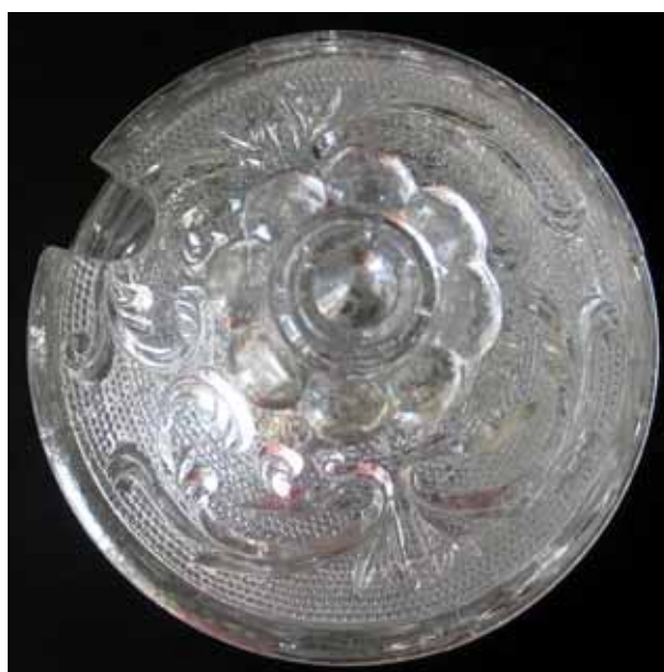
Deckel von innen