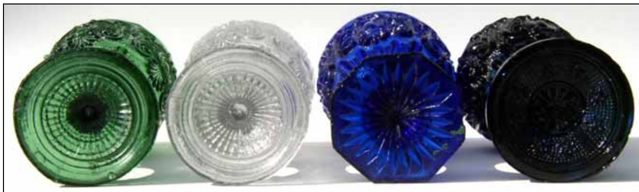
Abb. 2002-4/019; Abb. 2004-3/216 (Maßstab ca. 100 %)

Fußbecher mit neugotischen Motiven und Fußbecher mit Neu-Rokoko-Dekor, gekörnter Grund (sablée), Untersichten Sammlung Roese HR-232, farbloses Glas, H 11 cm, D 7,4 cm