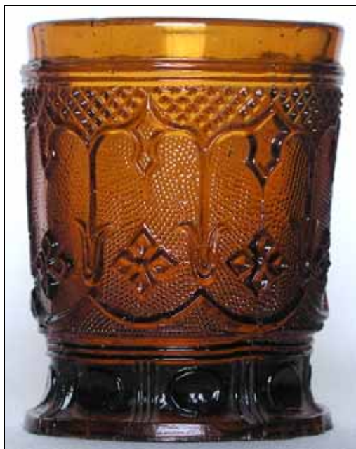
Abb. 2007-2/058 Becher mit neo-gotischem Dekor, Diamanten und Sablée dunkel bernstein-farbenes Pressglas H 8,5 - 9 cm, D oben und unten 6,0 - 6,5 cm Abriss, 4 Formnähte, Rand feuer-polirt Gewicht 265 g (blauer Henkelbecher 315 g) Sammlung Schaudig Hersteller unbekannt, Frankreich, um 1830, oder Böhmen, um 1850 vgl. Henkelbecher Sammlung Jargsdorf, Abb. 2000-2/254c