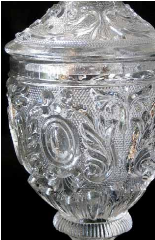
Abb. 2009-3/070 und rechts (Maßstab ca. 110 %) Senfgefäß mit Neu-Rokoko-Dekor und Sablée farbloses Pressglas, H mit Deckel 16,4 cm, H 12 cm, D 6 cm Sammlung Vogt, PV-590 Hersteller unbekannt, Frankreich, um 1830, oder Böhmen, um 1850

SG: Nach dem Hersteller dieser Fußbecher wird seit PK 1999-4 vergeblich gesucht. Sie wurden bisher gefunden aus farblosem, grünem, bernstein-farbenem, blauem und violett-schwarzem Pressglas. Der Fußbecher mit Deckel als Senfgefäß bestätigt meine Vermutung, dass es mit