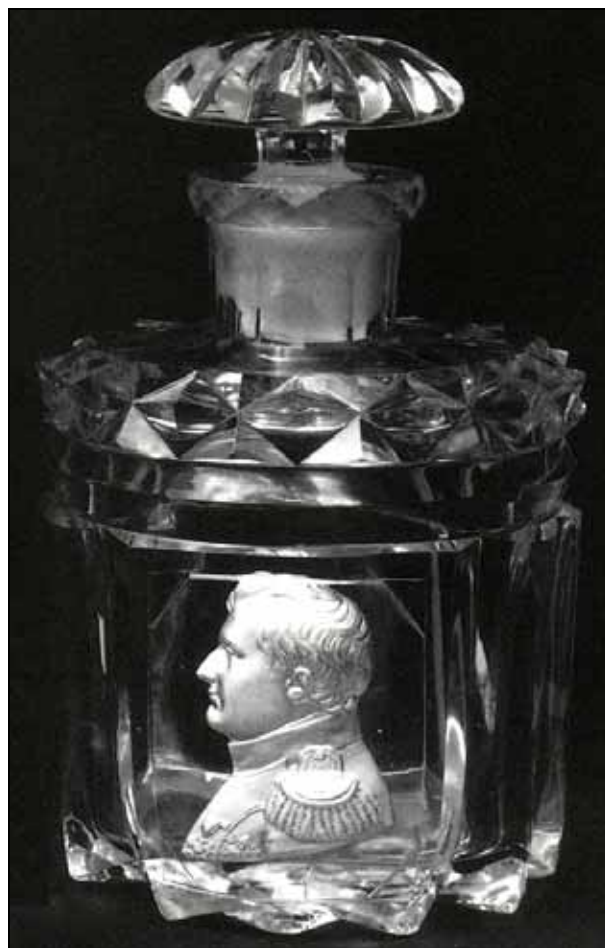
Abb. 2010-1/424 Flakon mit eingeglaster Paste Napoléon I. in Uniform nach links blickend, „Uniform eines Oberst der Garde“ Baccarat, ca. 1824, nach Medaille von Bertrand Andrieu aus Jokelson 1988, S. 33, Fig. 76

Es ist unmöglich, dass diese beiden Gläser von Baccarat um 1820 bzw. 1824 gemacht wurden, weil ab 1815 die Könige der Restauration Louis XVIII. und Charles X. jedes Andenken an Napoléon I. verboten hatten. Dieses Verbot wurde erst nach 1830 durch König Louis Philippe aufgehoben, s. PK 2009-3 & PK 2009-4 .