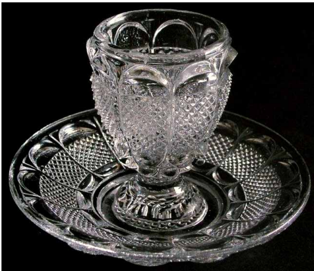
Abb. 2010-1/011 Senftopf (Deckel fehlt), farbloses Pressglas, H insg. 9,5 cm, D 5,3 cm, Teller D 13,5 cm Sammlung Schaudig s. MB Launay, Hautin & Cie., um 1840, Planche 9, Service à diamants et feuilles, No. 707, Moutardier sur plateau