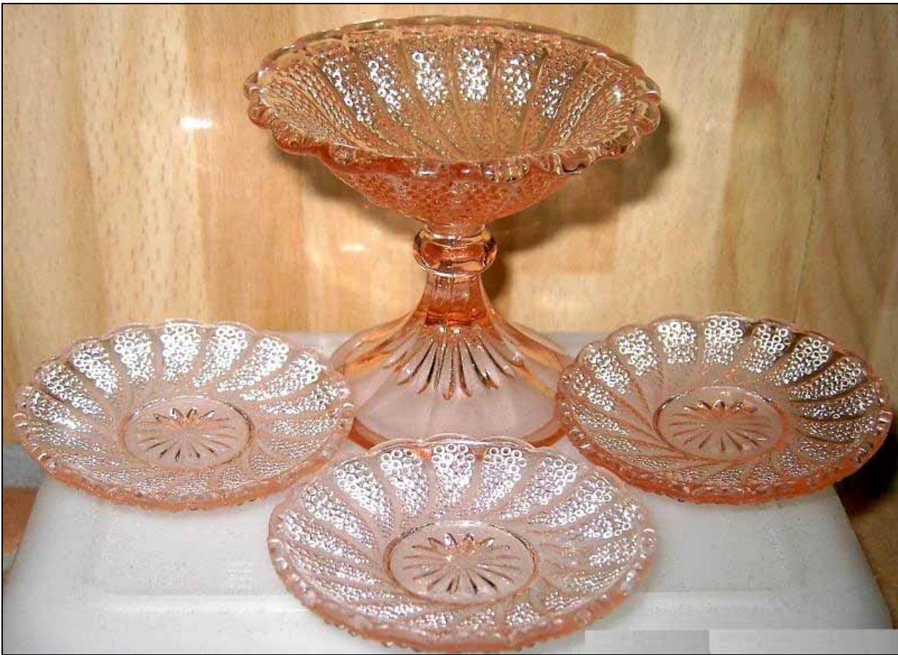
Abb. 2010-2/083 Tafelaufsatz mit Perlen-Muster, rosé-farbenes Pressglas, Aufsatz H 7,5 cm, D 8 cm, Teller D 6,5 cm, vgl. PK Abb. 2009-1/292 Hersteller unbekannt, um 1900